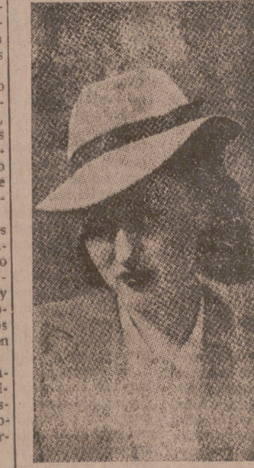
Fieltro blanco extraligero (70 gramos) con cinta de fieltro azul marino