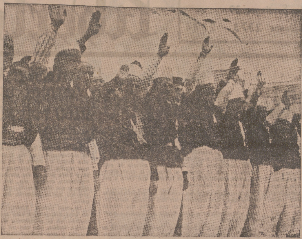
Los albaneses saludan ya brazo en alto. He aquí un grupo del Fascio de Tirana