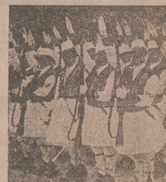
La Guardia Real albanesa rinda honores, brazo en alto, a S. M. el Rey-Emperador de Italia.

El uniforme y la prestancia de estos curtidos soldados recuerda el ambiente de su país, y la figura despótica de Zog se ha esfumado de sus ojos ávros, que buscan en el Rey-Emperador un símbolo alto donde fijar sus azares de ser gobernados seriamente.