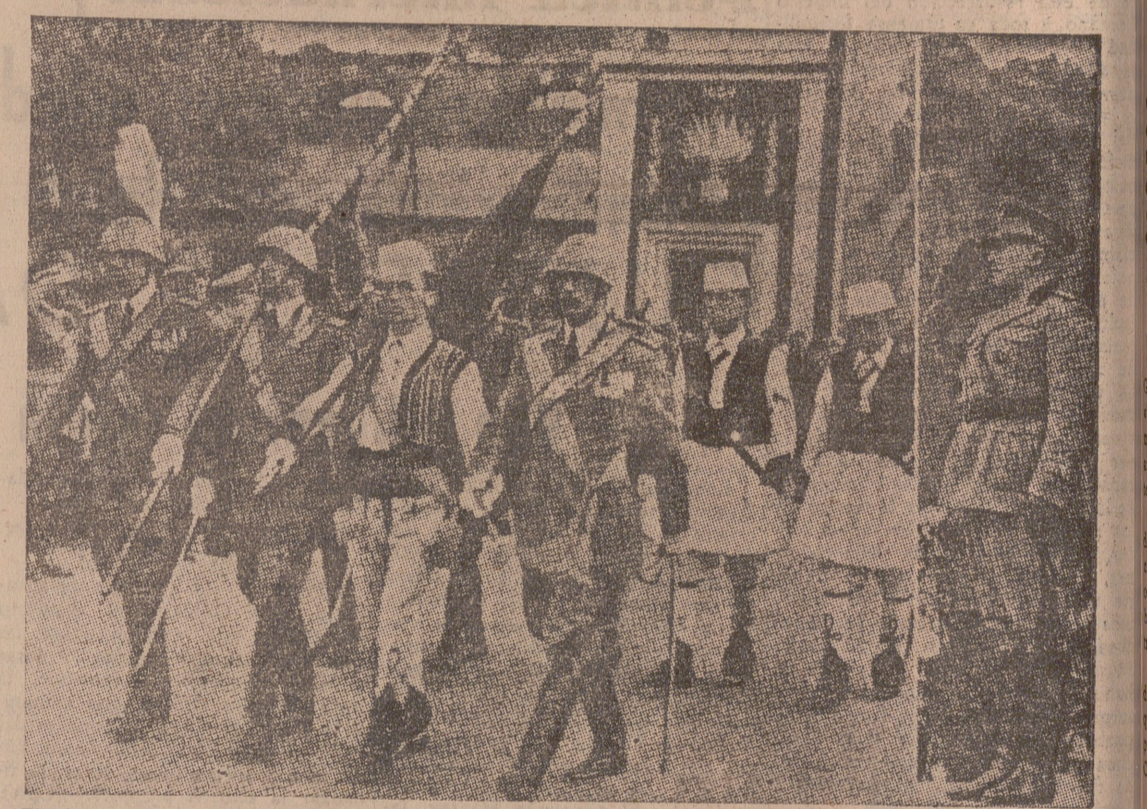
El rito del juramento de la Guardia Real de Albania.—Un momento del desfile, presenciado por el general Parlani

Ankara, 3.—Ayer fué obsequiado con una recepción en un hotel de la ciudad el general Weygand, por el ministro de Negocios Extranjeros y el de la Defensa Nacional del Gobierno de Turquía.—(CSA).