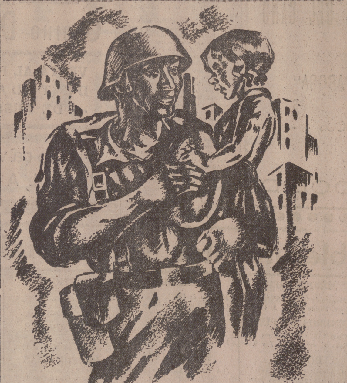
Los soldados de Franco le evaban cariño y pan donde sólo había miseria y odio (Dibujo de ITO)

Coral Vallisoletana. Se reuena a los coralistas que concurrían hoy, a las siete y media de la tarde, a la sala de juntas de la Casa Social Católica. Se solicita la puntual asistencia.