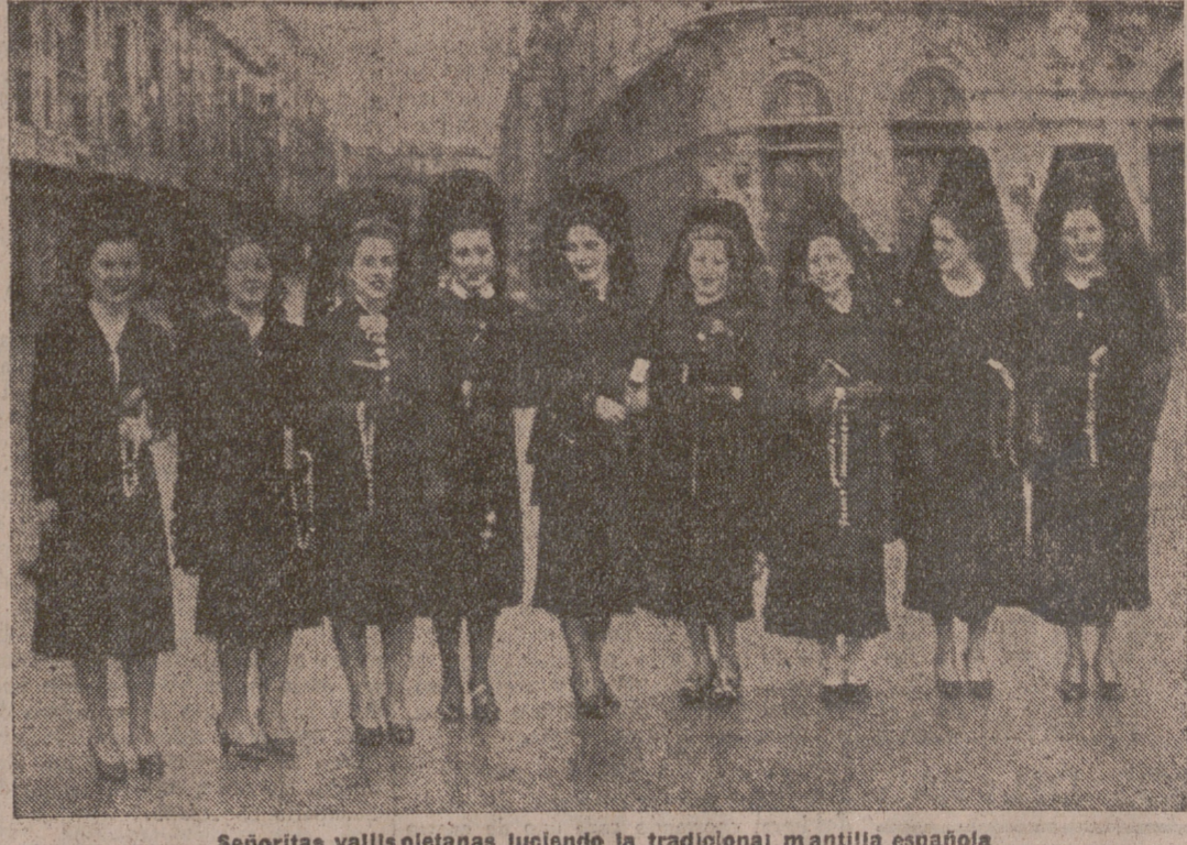
Señoritas vallisoletanas luciendo la tradicional mantilla española

Para remediar el hambre y la escasez de la extensa zona recién redimida, contribuye a las suscripciones de AUXILIO A POBLACIONES LIBERADAS