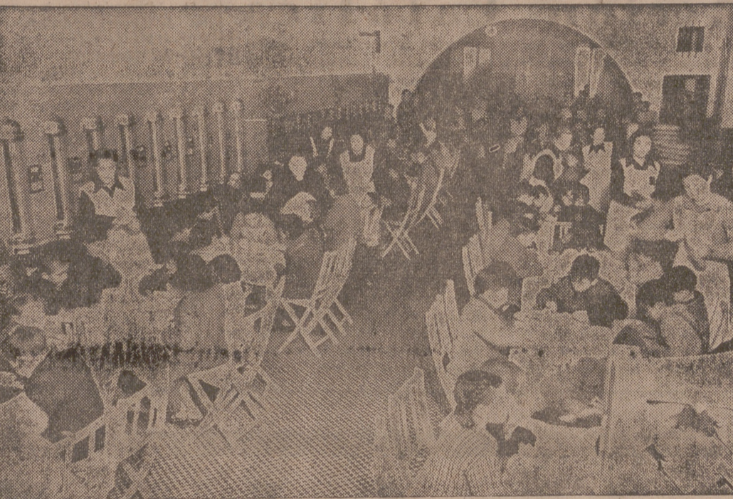
«AUXILIO SOCIAL» reparte en Madrid 800.000 comidas diarias