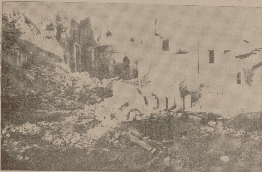
Ruinas que dejaron los rojos

Tres pueblos restan por ocupar en la margen derecha del río, donde los marxistas se ven agobiados por