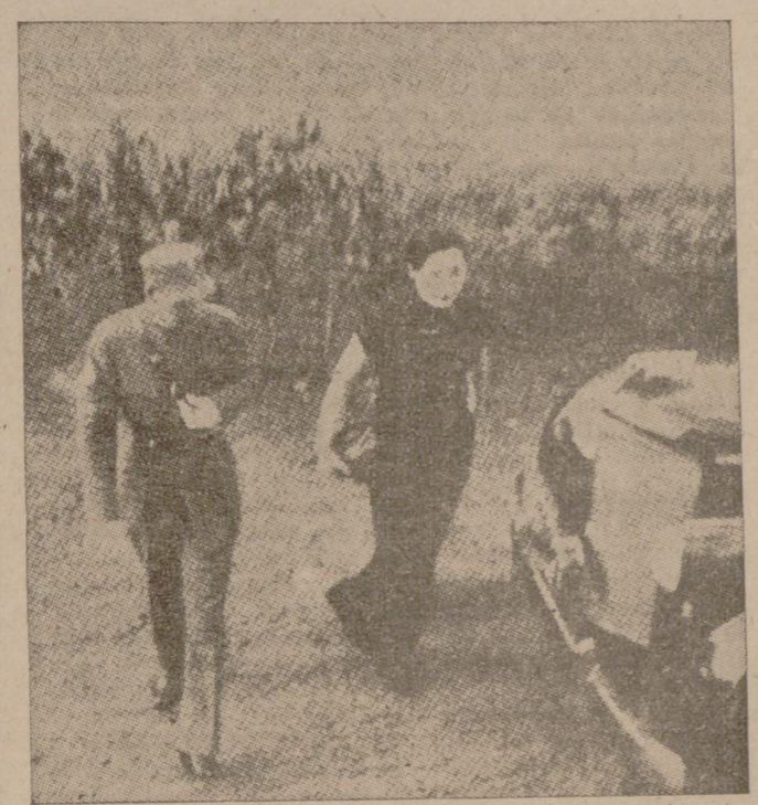
El generalísimo del Ejército chino con su consorte, en una recientísima fotografía hecha en Hanko poco antes de la huida al ocuparla las tropas japonesas