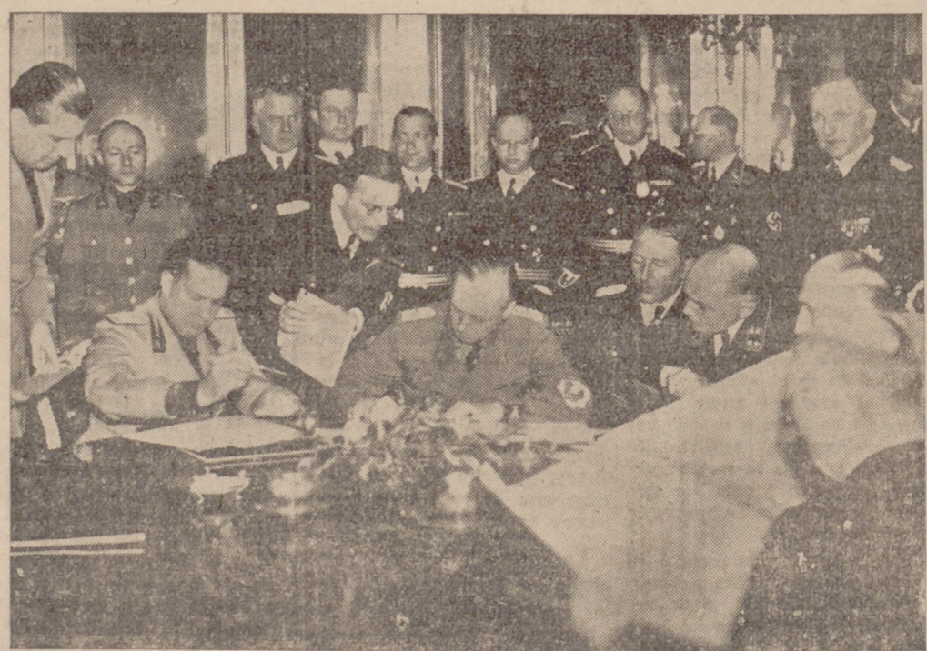
Los ministros de Asuntos Exteriores von Ribbentrop y el conde Ciano firmando en Viena el acuerdo referente a las nuevas fronteras de Checoslovaquia y Hungría. Mediante esta sentencia arbitral se incorporó a Hungría unos 12.400 kilómetros cuadrados con un millón de habitantes.

Conforme a las órdenes del jefe genial (sic), el partido comunista francés debe de ahora en adelante ser un partido de lucha de clases activa. Sólo a este precio se logrará la seguridad de la patria del proletariado mundial.