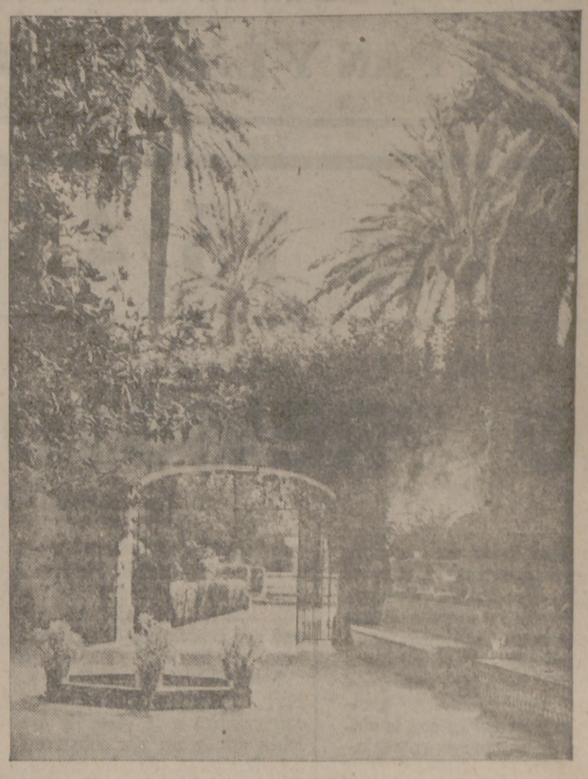
Una vista del jardín del Alcázar de Sevilla