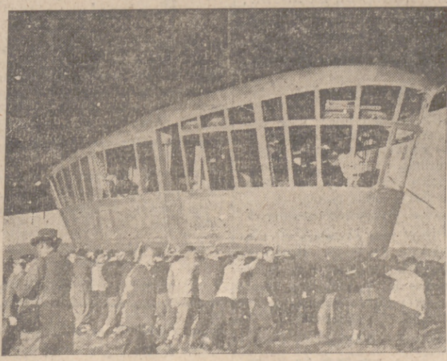
El "Graf Zeppelin", después del primer vuelo de ensayo, que duró diez horas, amarra en el aeropuerto de Friedrichshafen