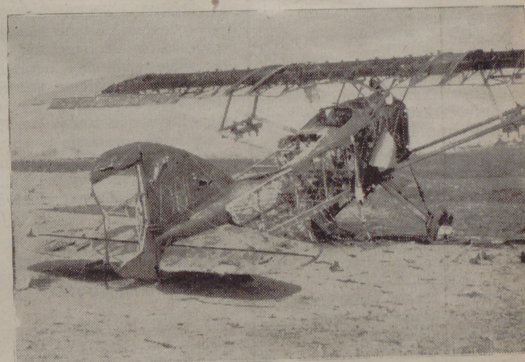
Uno de los aviones rojos derribados por la aviación nacional

Volverá a reír la primavera que por cielo, tierra y mar se espera. ¡Arriba escuadras, a vencer! que en España empieza a amanecer.