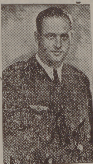
El comandante de Aviación García Morato, laureado de San Fernando, ejemplar figura entre los aviadores españoles

"El hecho nuevo es que el aire se ha abierto a las operaciones aéreas. Este hecho rompe, brusca, e imprevisiblemente,