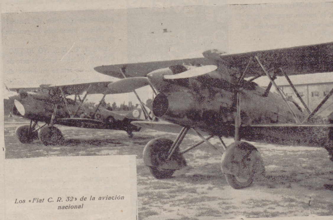
Los «Fiat C. R. 32» de la aviación nacional

Escritorio: Carretera de Salamanca, núm. 35 - VALLADOLID - Teléfono 1649