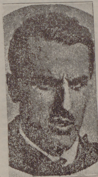
Carlos Haya, el aviador bilbaíno, recordman en la paz y as de ases en la guerra, muerto bajo los altos cielos aragoneses en el cumplimiento de su deber

Y empezaron a conocerse las cifras de los aviones enemigos derribados en combate: en los pocos días del mes de julio se derriban 40; en agosto, 45; en septiembre (ofensiva de Extremadura y Toledo) caen 61, con lo cual apenas si les van quedando "existencias" de los