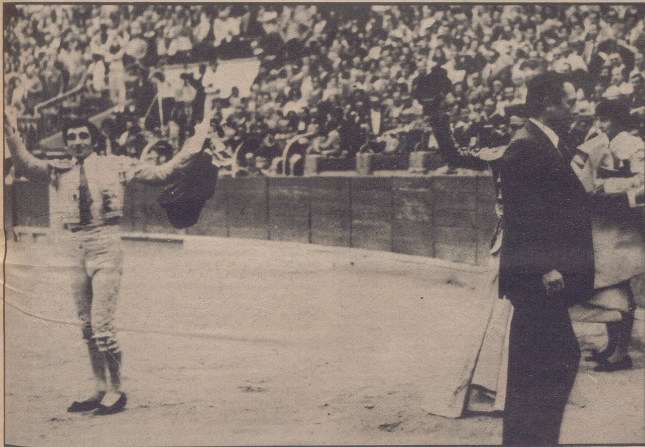
Saludo victorioso: Dámaso, Marca, el ganadero, y tras él, Paquirri

¿Fueron verdaderas las cuatro orejas y los dos rabos y la salida al tercio del ganadero?