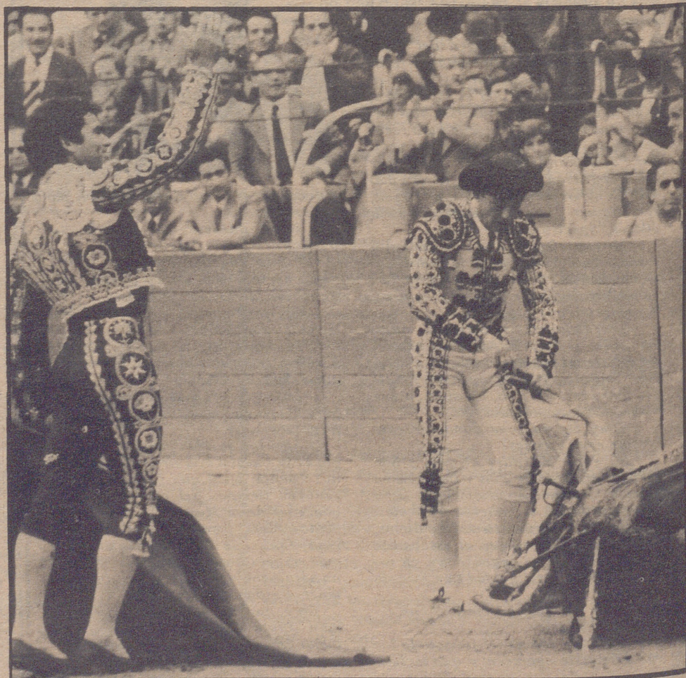
Paquirri saluda triunfador después de matar a su primero

En el caso de José Mari Manzanares hoy hay que hablar de verdadera mala