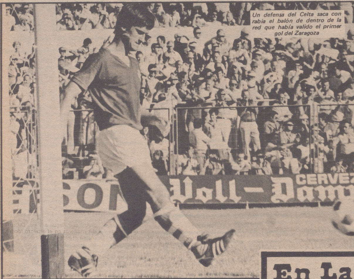
Un defensa del Celta saca con rabia el balón de dentro de la red que había valido el primer gol del Zaragoza