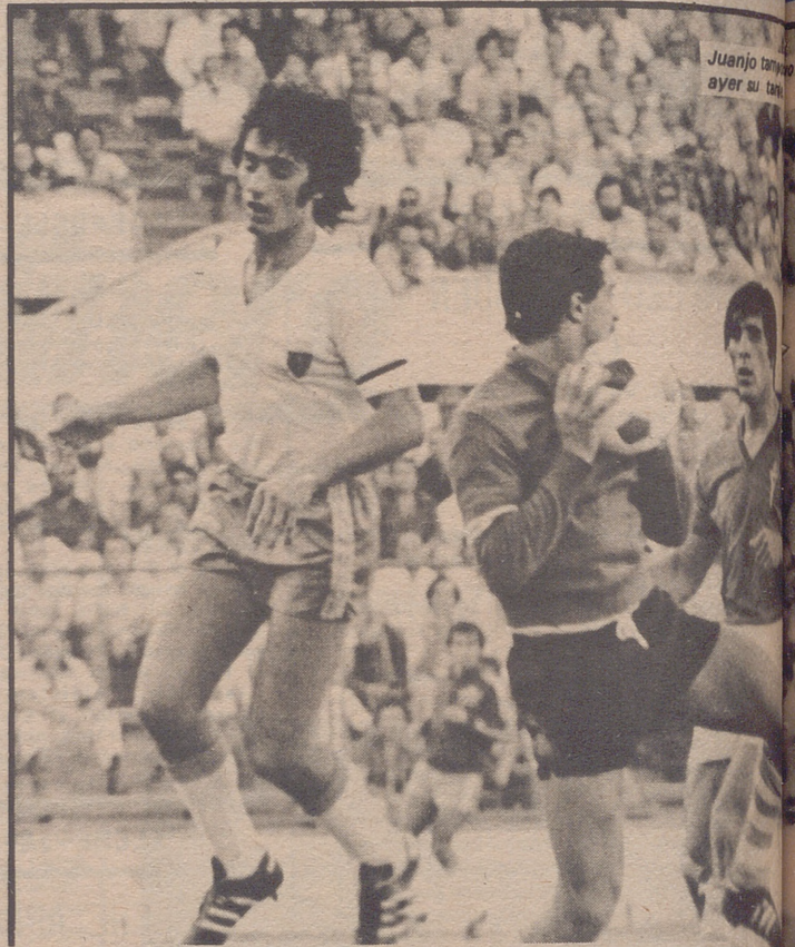
Juanjo tarra ayer su tarra