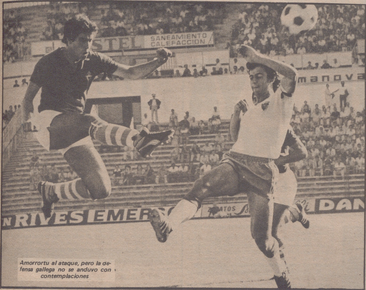
Amorrortu al ataque, pero la defensa gallega no se anduvo con contemplaciones

NUEVA YORK, 11 (Efe).— El norteamericano Jimmy Connors triunfó en el open de tenis de los Estados Unidos, al vencer en la final al sueco Bjorn Borg en tres sets. Connors se impuso a su adversario por seis-cuatro, seis-dos y seis-dos. La final femenina la ganó Everts.