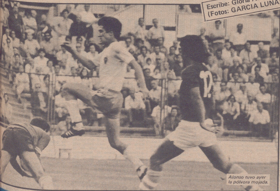
Alonso tuvo ayer la pólvora mojada.

Escribe: Gloria ARIAS