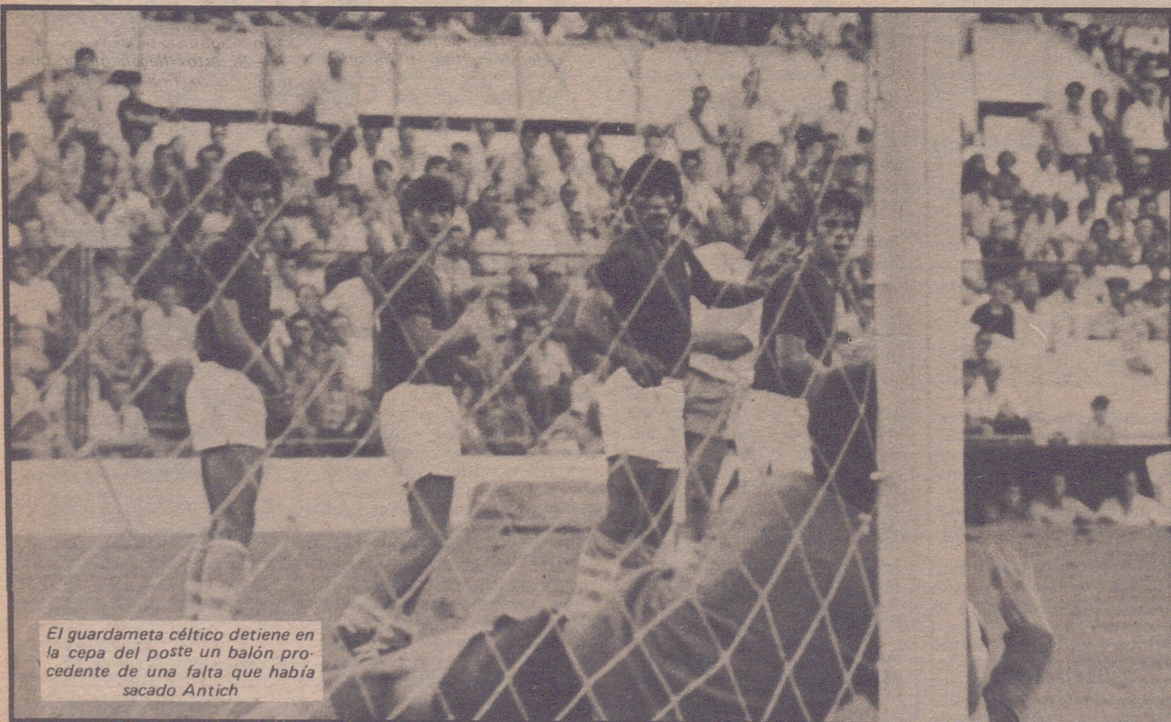
El guardameta céltico detiene en la cepa del poste un balón procedente de una falta que había sacado Antich

El Zaragoza, en lugar de serenar su juego, quiso aumentar el tanteo a base de forzar la máquina, y la