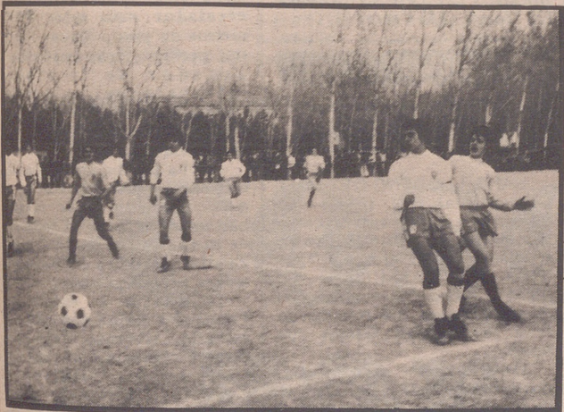
CALASANZ, 0; R. ZARAGOZA, 0

Gran ambiente en Escolapios, que registró una magnífica entrada, a pesar de jugarse el partido por la tarde, mucho viento y frío, que no fue obstáculo para que los dos equipos, se entregaran a una lucha sin límites en busca de la victoria.