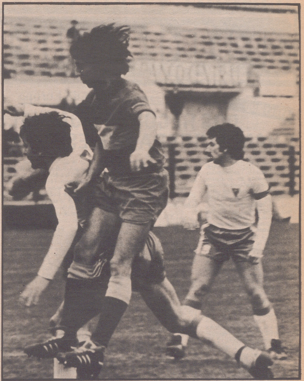
Los visitantes vendieron cara su derrota, pero al final caerían porque en futbol el que más ataca es el que más posibilidades tiene de ganar.

En resumen, flojo partido en La Romareda pero excelentes puntos, que permiten al filial zaragoista seguir con la mayor ilusión en pro de lograr el ascenso de categoría.