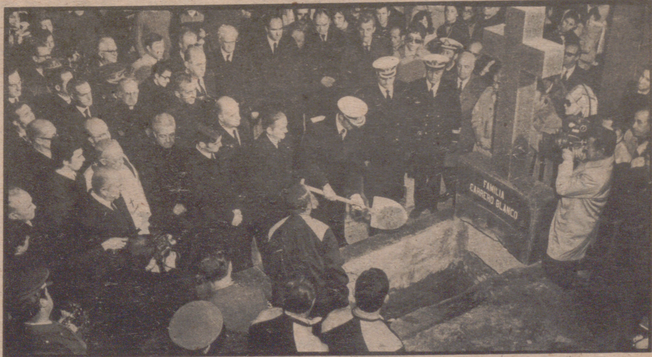
"ARAGON/exprés" PAG. 3

De él puede decirse —continuó el alcalde— literalmente que vivió para España y que murió por ella. Y estamos seguros de que en la eterna luz que disfruta, su muerte en acto de servicio le parecerá un premio con que Dios ha querido coronar una vida extraordinaria. Suele decirse que una noble muerte honra toda una vida. Y es verdad. Pero el almirante Carrero Blanco no necesitaba la trágica muerte que tuvo para honrar una vida que fue honrada a carta cabal desde el principio al fin. Su muerte fue sólo el espaldarazo con que la historia le ha permitido ingresar en la lista de los españoles inmortales.