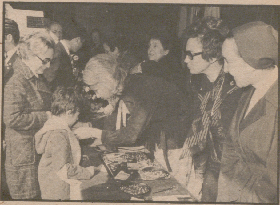
MADRID. — Madrid celebró ayer la tradicional Fiesta de la Banderita, cuestación anual en favor de la Cruz Roja Española. En la foto la Princesa de España, doña Sofía que presidió una mesa petitoria instalada en la avenida de José Antonio recibe el donativo de una niña.