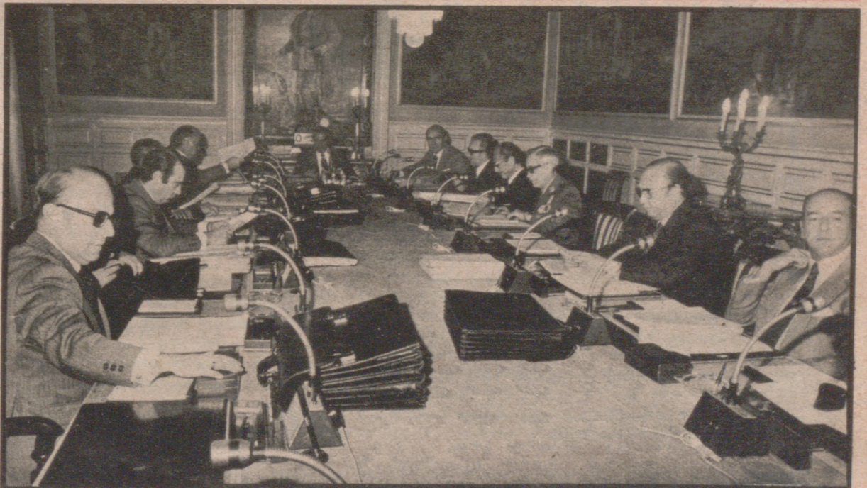
El Gobierno, reunido en el consejo de ayer.