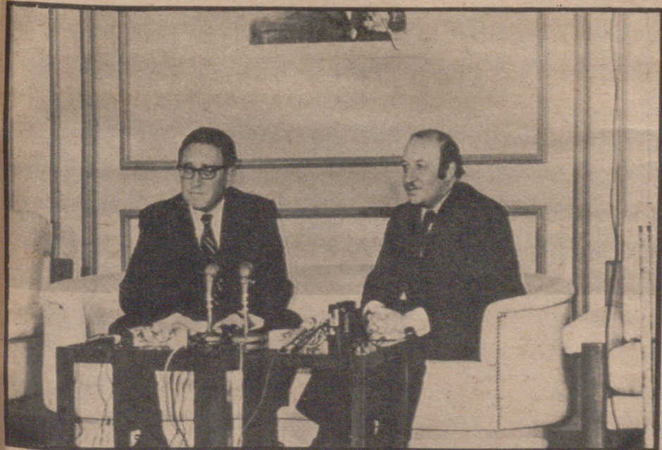
AMMAN (Jordania). — El secretario norteamericano de Estado, Henry Kissinger, en Amman, donde fue recibido por el Jefe del Gobierno jordano, Zeid Refayi, con quien aparece en la foto durante una conferencia de Prensa en el aeropuerto local.