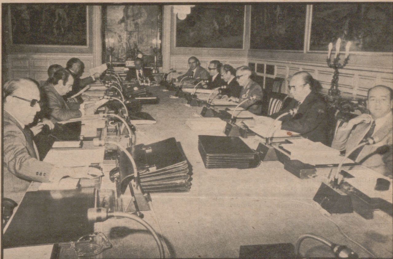
Los ministros reunidos en el consejo de ayer.

«El Alcázar» sugiere que pudieron haber sido lanzados por la «C.I.A.» Toda la atención política, centrada en el «decisorio» de hoy