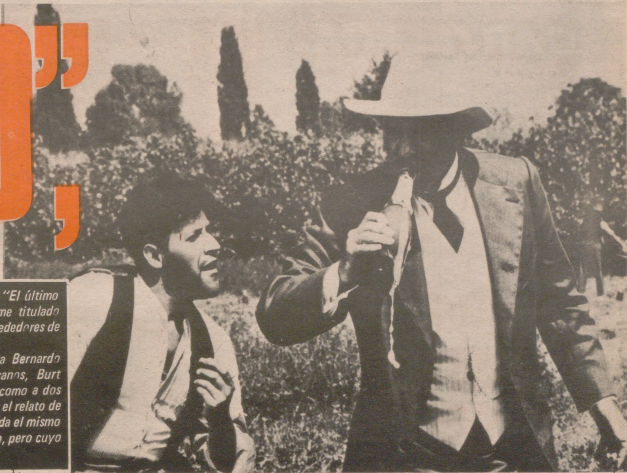
Burt Lancaster y Sterling Hayden, desempeñan importantes papeles en "1.900", nueva película del realizador italiano Bernardo Bertolucci.

B ERNARDO Bertolucci, el realizador de "El Conformista" y "El último tango en París", está terminando el rodaje de su nuevo filme titulado sencillamente "1.900", en una granja dos veces secular de los alrededores de Parma.