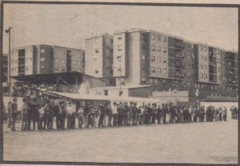
Vista panorámica del nuevo campo en Las Fuentes