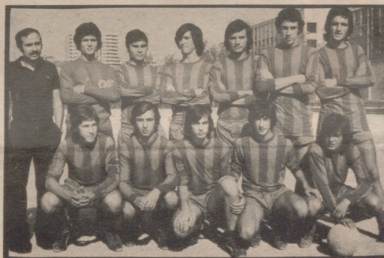
El Boscos cuenta sus partidos por victorias, en Escolapios logró despegarse y seguir en la línea de la pasada temporada