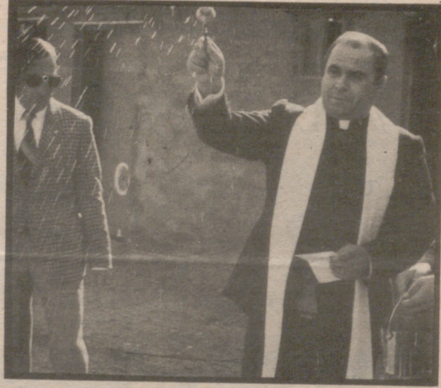
Bendición de las instalaciones