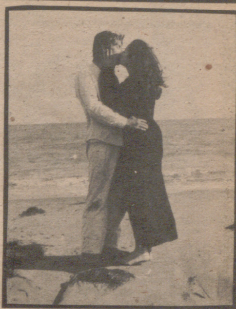
"La huella" fue una de las películas presentadas al certamen. En la fotografía, una escena del filme.

—Por supuesto que sí, y no sólo anima a la gente a hacer cine, sino que atrae más socios