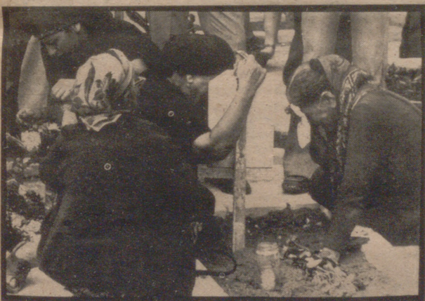
JERUSALEN.— Cuatro mujeres de Israel lloran junto a una tumba, la de uno de los 2.600 soldados muertos en la guerra de 1973. Ahora, de acuerdo con el calendario hebreo, se ha celebrado el aniversario del final de esta guerra con funerales celebrados en el Monte Herzl y en otros comentarios de la región y en todo el país.

WASHINGTON, 16. (Crónica especial por Lewis GALLY, de "The Washington-Post", en exclusiva para ARAGON/exprés).