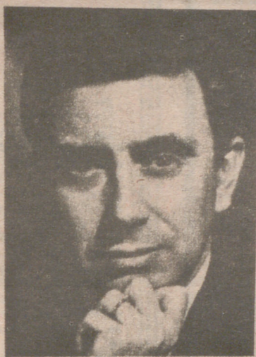
LUIS MARIA ANSON