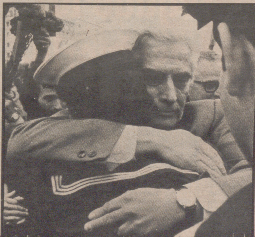
Alvaro, Cunhal, líder del Partido Comunista Portugués, abraza a un marinero durante la celebración del 1 de Mayo. Cunhal permaneció doce años en el exilio.

ERA NECIO LIMPIAR L ESTALLA DMINISION DE LOS ESIDUOS ALITARIOS"