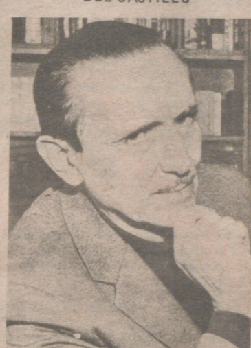
ANTONIO BUERO VALLEJO

nación vecina una política de Frente Popular. En contrapartida, creo que la política será de profundas reformas sociales y de enérgica reducción disciplinaria parigual de la oposición oligárquica o burguesa a las masas y del desborde maximalista de las masas y de sus posibles dirigentes demagógicos.