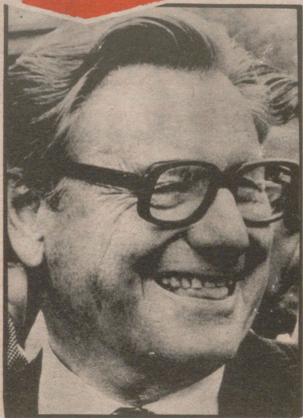
WASHINGTON, 16 (Crónica por Jules WITCOVER, del "Washington Post", en exclusiva para "ARAGON/exprés").

Los republicanos conservadores temen por el futuro político de Ford