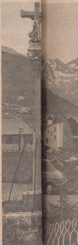
El Pirineo en cuanto turística, luego, también cumbres.

de España, provincia, llevan al Pirineo a atender cumplidamente el gobierno.