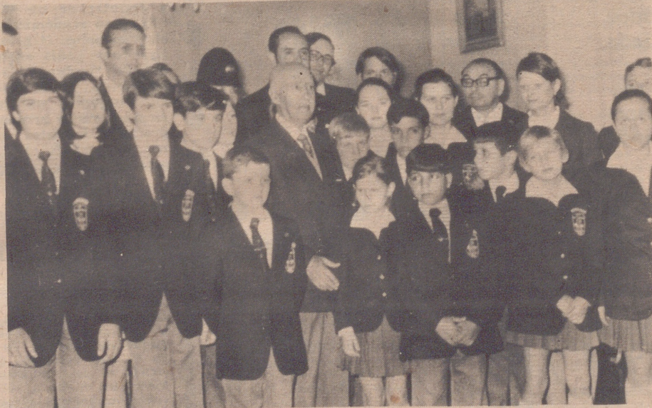
SAN SEBASTIAN. — Su Excelencia el Jefe del Estado durante la audiencia concedida a los pequeños participantes en la Operación Plus Ultra, en el Palacio de Ayate de San Sebastián. (Foto: Ap-Europa Press).