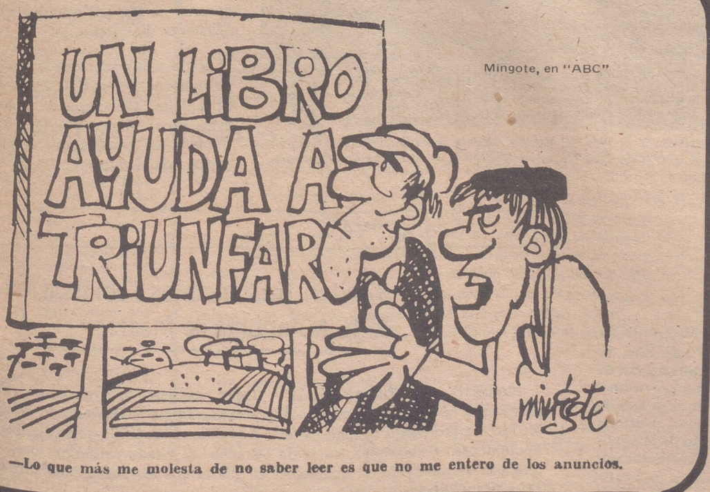
Mingote, en "ABC"

Esta demostración de fuerza de la izquierda chilena se ha realizado en un clima poco propicio — fuertes subidas de precios, descontento general, dificultades económicas — en el que los grupos de la oposición van clarificando posturas cara a las próximas elecciones. Hasta entonces, el Gobierno de Allende tendrá que superar una serie de dificultades.