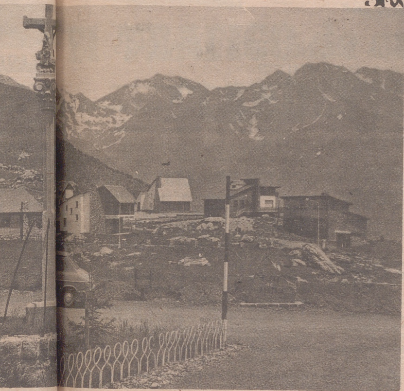
El Pirineo en cuanto a cantidad de visitantes en esta temporada turística. También se puede gozar del paisaje nevado en las altas cumbres.

de España, provincia, llevan al Pirineo. Sigue sin resolverse la situación y mejora de las carreteras que