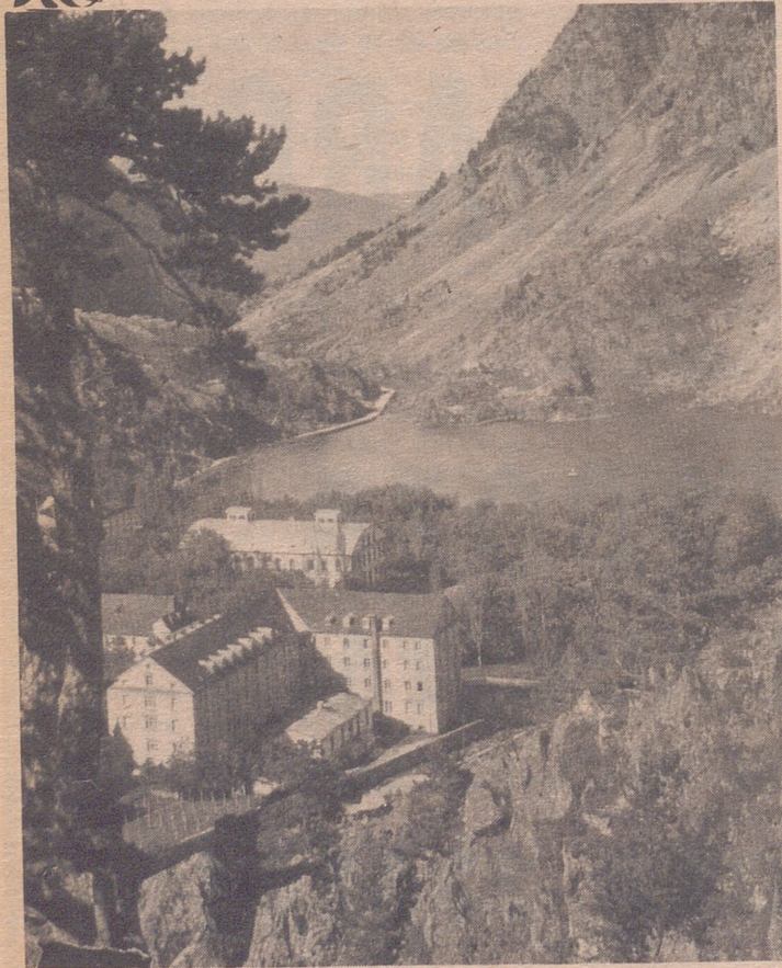
El paisaje altoaragonés impresiona vivamente al turista. Si se le sabe sacar todo el partido que indudablemente tiene no será nada difícil el que muy pronto, tanto en invierno como en verano, sea una de las mayores fuentes de economía del país.

H OY como nunca sigue siendo aspiración no resuelta, lograr se nos comprenda en la red primaria de carreteras nacionales para alcanzar los siguientes objetivos: conseguir estén correctamente unidas las principales ciudades; atender la comunicación con las economías de las regiones catalana y vasconavarra, en las que radican nuestros principales clientes y proveedores; facilitar el tránsito de las corrientes comerciales que van de Cataluña o Vascongadas o viceversa, que tiene por la Provincia el camino más corto; atender las corrientes comerciales que desde el interior