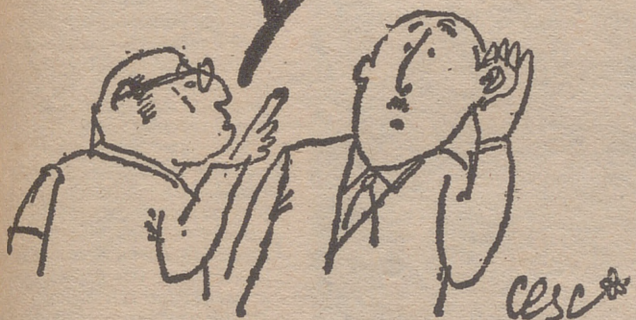
Cesc, en "EL CORREO CATALAN"

ES QUE LAS SEÑALES DE ALARMA SOLO FUNCIONAN EN ASUNTOS ECONÓMICOS, NO EN LOS POLÍTICOS.