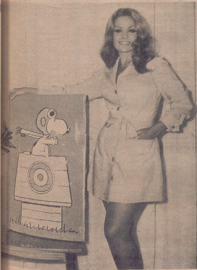
CARACAS, 14. (Efe).- La actriz y cantante española Carmen Sevilla se presentó anoche en un programa informativo de la televisión venezolana en vísperas de efectuar el despeje de la plaza en la "Corrida de la Prensa", que se celebrará en la ciudad de Valencia el próximo domingo. Carmen Sevilla, que se encuentra desde el miércoles en Caracas, se mostró muy satisfecha de haber podido aceptar la invitación para visitar Venezuela que le habían hecho en varias ocasiones. La actriz, afirmó que admira a "Luis Miguel Domínguez en su mejor época, Antonio Ordoñez y Paco Camino, que parece ser el mejor del momento", y añadió: "me gusta ver a mi compadre "el Cordobés". En la "Corrida de la Prensa" tomarán parte los diestros españoles Paco Camino, Francisco Rivera "Paquirri" y el venezolano Curro Girón.

Hará el despeje de la plaza en la "Corrida de la Prensa"