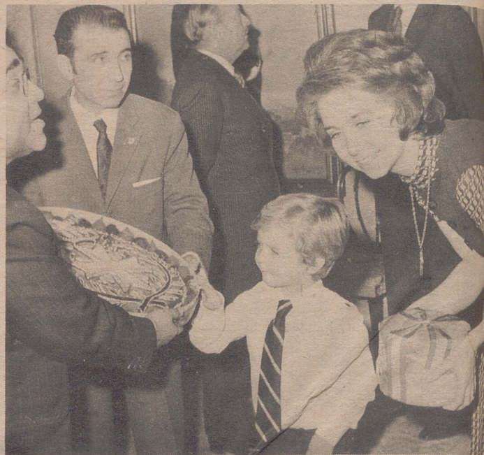
MADRID.— Los príncipes de España acompañados por su hijo el Infante Felipe, reciben a los miembros del ayuntamiento de Consuegra (Toledo) quienes obsequiaron al pequeño príncipe, con un queso, una "angulla" de mazapán con el escudo de la localidad y dos corderos.