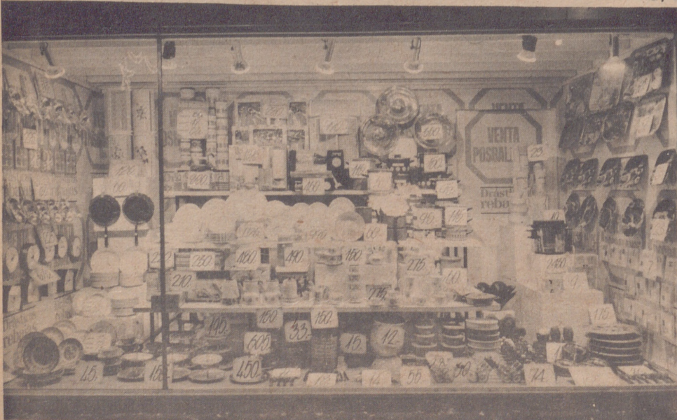
En menaje artículos de venta Posbalance.

Punto final señores. Relájense, lo demás ya será lo de mañana. Volver a insistir sobre lo mismo. Nunca había conocido Zaragoza un suceso comercial de parecida índole. Y yo sí que les digo a ustedes, "Felices compras amigos". Pero, como decían por aquí: Sin "arrempujar", hay para todos.