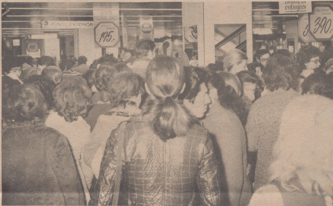
Enorme gentío comprando en la venta Posbalance en "Galerías"

Creo que se han roto unos cristales. La gente ni se inmuta. Veo un empleado que se dirige a retirarlos, con paso matemático, como si hasta la rotura del cristal estuviera ya prevista. Al fin ya estoy dentro de GALERIAS. En su planta baja me acerco, como Dios me da a entender, a una