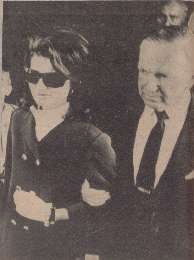
Por Peter FRENCH

Y el periodista recordó que todos los guardaespaldas del fallecido presidente Kennedy no lograron evitar, a pesar de ir armados hasta los dientes, que su protegido fuera asesinado en Dallas.