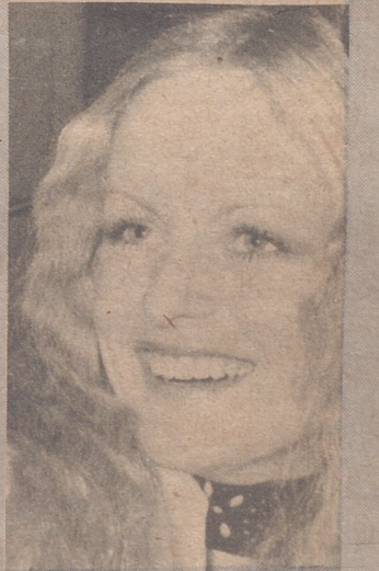
con piel blanca y cuello también de piel en renard rojo. ¿Qué más parece esta sinfonía de... mal gusto?

Entre las mujeres peor vestidas del año, según la lista norteamericana, figura la modelo inglesa "Twiggy" entre otras. Sus excentricidades la han hecho merecedora del título, y es que la maniquí combina de una manera desastrosa su vestimenta. Las últimas fotografías de la modelo, tomadas en el aeropuerto de Londres, muestran a la delgadita Twiggy, con un traje de corte masculino, pantalón y chaleco en patá de gallo blanco y negro. Lo acompaña con una camisa estampada y una chaqueta en tonos verdes de príncipe de gales. Sobre el traje un abrigo de piel de reptil de color marrón forrado