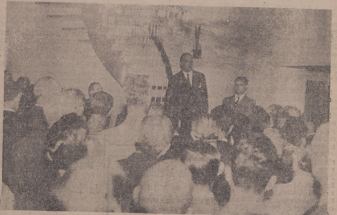
El nuevo ministro de Información y Turismo, don Manuel Fraga Iribarne, ha ofrecido una recepción a los directores de los periódicos, corresponsales de Prensa extranjera y otras personalidades del periodismo, con los que tuvo un amplio y animado cambio de impresiones y a los que pidió estrecha colaboración y a los que dijo "que la puerta de su despacho estaba abierta para cualquier sugerencia".