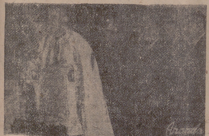
El abad de la catedral bendice las instalaciones de la nueva guardería.

Los maestros que obtengan beca vienen obligados a presentarse durante las últimas decenas de los meses de diciembre y marzo del curso 1962-1963, en la Dirección General de Enseñanza Primaria, volante suscrito por el decano de la Facultad en la que cursen sus estudios acreditativo de la asistencia a las clases teóricas y prácticas y de buena conducta y aprovechamiento.