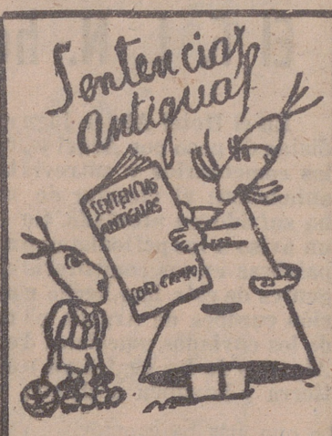
Por DEL CAMPO

Los pelotaris visten de blanco porque su deporte, viril y difícil, es, en el fondo, el más inocente.