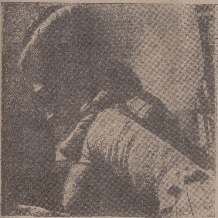
En el mismo corazón de Valencia, con el fondo de la fachada principal del Ayuntamiento, se alza la gran "falla" de la Plaza del Caudillo, de la que en nuestra fotografía ofrecemos el detalle de una de las figuras. "La plantá" de las fallas se lleva a cabo dentro del alegre y trepidante rito fallero.

Quizás, la reunión se celebre hoy por la tarde