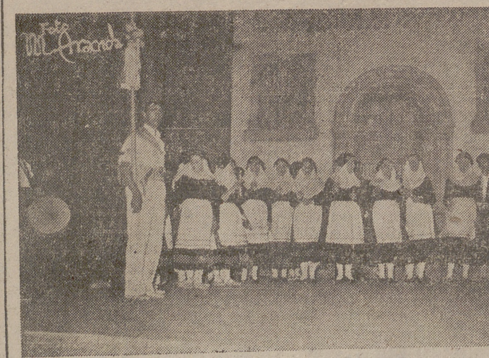
Las voces de las muchachas de Alfaro entonan la bella melodía de "Las campanillas".

Todos los meses, la Cátedra Ambulante de las mujeres falangistas de Logroño hace acampada y cuartel general en un pueblo cualquiera. Y en sus treinta días de esfuerzo y de afanes para hacer de las mujeres y de las jóvenes lo que de ellas la Patria reclama y enseñarles las santas virtudes del hogar y de la religión o las otras enseñanzas de labores y de industrias rurales, a cada nueva singladura retornan de su viaje con la alegría de una, dos o varias danzas que han ganado al olvido y que por su labor abnegada se bailarán de ahora y para siempre en la Rioja. Canta y baila la Sección Femenina riojana con alegría de alma y corazón sus danzas ancestrales y su canto y su baile se funden en todos los rincones de la tierra con otras empresas de más envergadura, acaso en lo político o en lo social, pero tan honda y entrañablemente sentidas co-