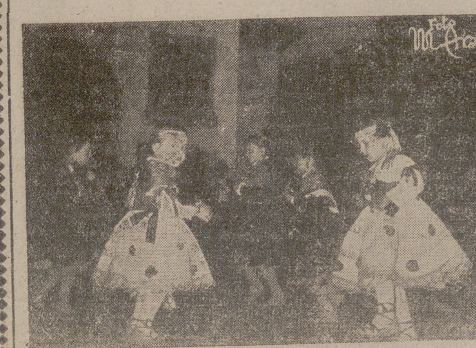
Las pequeñas suscriptoras de "Bazar" se ganaron las mejores y más cariñosas ovaciones de la tarde.