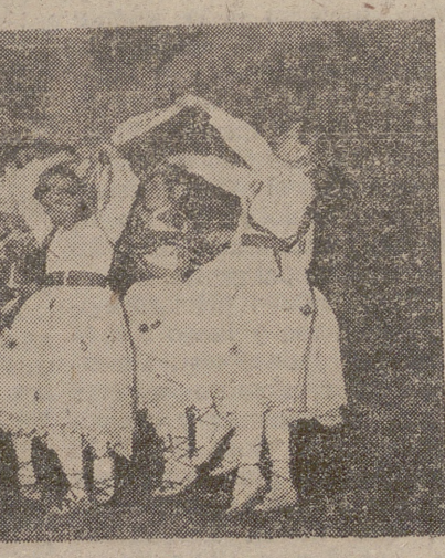
El juego de los pañuelos dentro de la danza es una bella constante del folklore riojano.

falangista femenina, al traer a este escenario el alma de la tierra riojana, al verla y descubrirla con toda su pureza