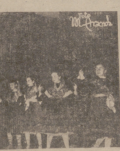
Así comenzó el festival. Con "la danza de saludo a las autoridades", de Treviana.

Después de estas palabras, fábula y signo del festival, el escenario cobró vida con todas las danzas regionales. Treviana y Laguna, Albelda y Ventosa, Sorzano y Nieva, Briones y San Asensio, San Millán y Santo Domingo, Ezcaray y Mansilla, Leiva y Cervera, Cañas y Muro de Cameros fueron nombres que se sumaron al de Logroño; hechos en todos los casos luz y color, alegría y arte hasta crear una serie sucesiva de estampas a cual de mayor belleza, que, sumadas, constituían el festival de más al-