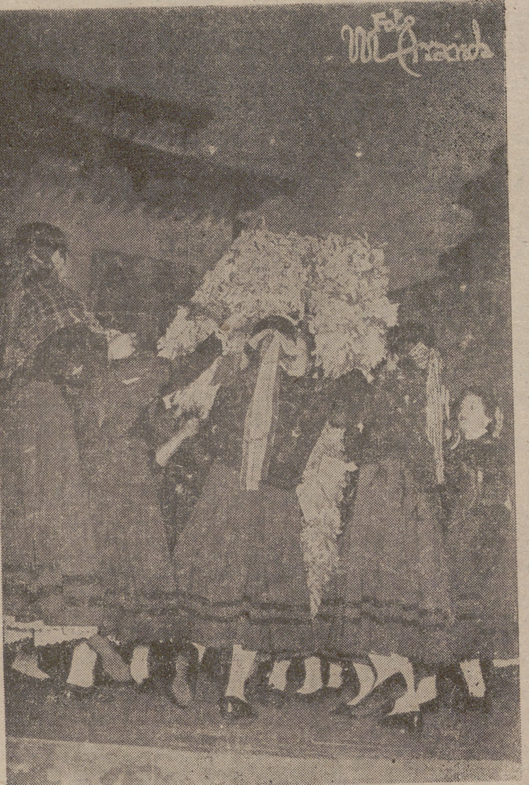
Una de las más bellas danzas riojanas: "Los arcos", acaso en el momento de más colorido y relieve.