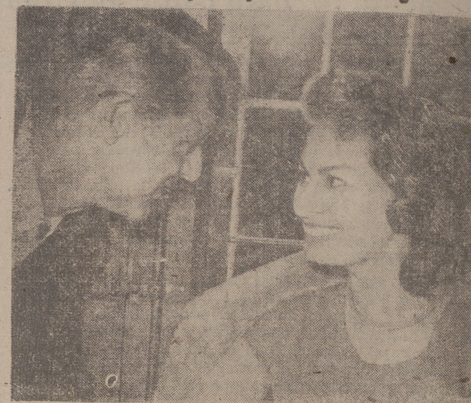
En la foto, los famosos artistas de cine Sofia Loren y Cary Grant, que se encuentran en Segovia, donde rodarán escenas de la película "Orgullo y pasión". Los artistas charlan sobre el trabajo de la película en el "hall" del hotel donde se hospedan. — (Foto Torremocha).