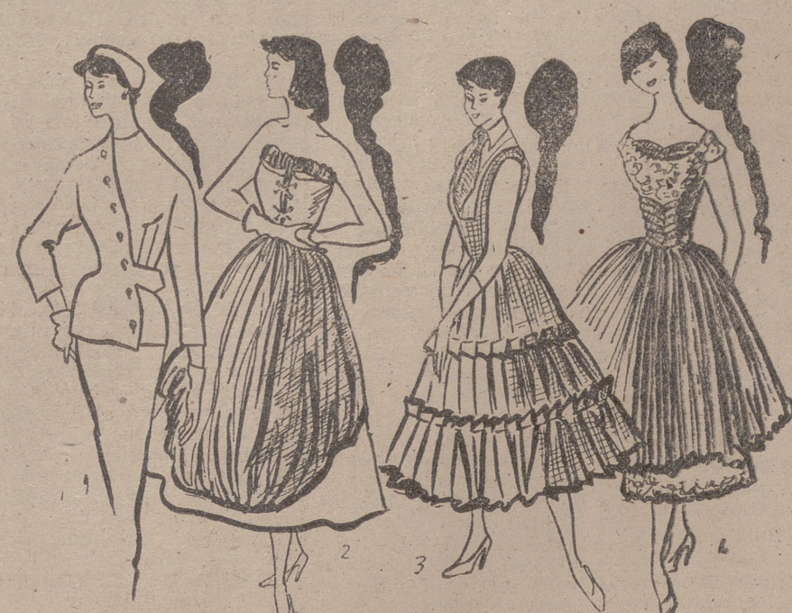
4.-Conjunto en blanco y rojo. Cuerpo y doble falda en guipur blanco. Falda plisada soleil, corsélete con loras y escote de nylon rojo. Antonelli.

Se dice que los españoles somos incorregibles. Nos gusta más lo de fuera, sólo por eso, por ser de fuera. Pero no siempre ocurre lo mismo. (¿Será la excepción que confirma la regla?) Hemos regresado de Italia con la sensación de que nosotros valemos más. Las exhibiciones de moda presentadas estos días nos han dado la impresión de que nuestros vecinos aman lo barroco, lo suntuoso, y andan tras la originalidad y las ideas nuevas, con perjuicio muchas veces de la sencillez y sobriedad que son la base principal de la elegancia. El color elegido por los creadores italianos para esta primavera es el azul, animado con un toque rojo o blanco. Después sigue el negro y los beige palidísimos. Insisten casi todos los modistos