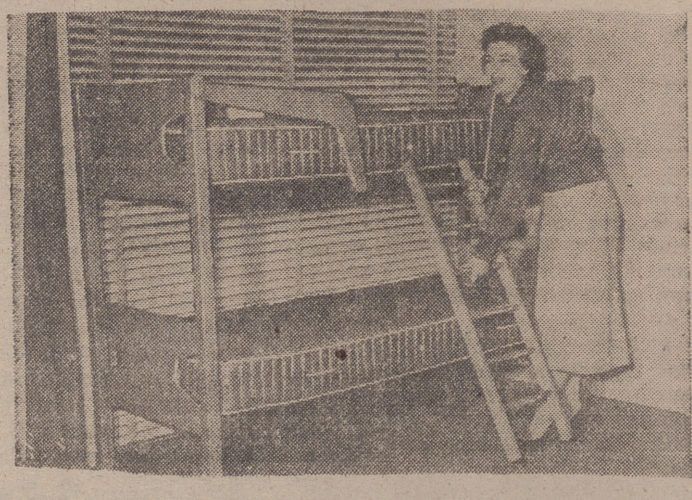
LITERA DOBLE PARA NIÑOS, que llamó extraordinariamente la atención en el EARL COURT de Londres durante la exposición británica de muebles de todos los estilos.