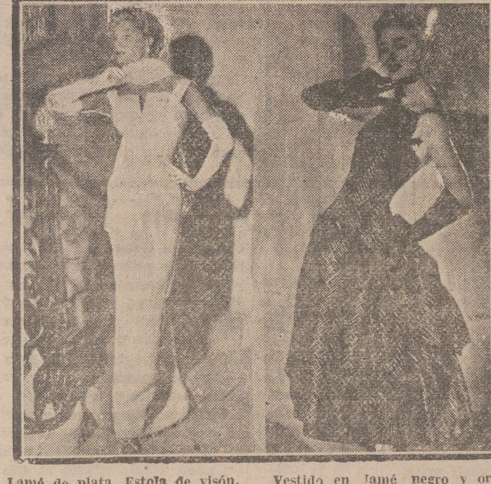
Lámé de plata. Estola de visón, blanco. (J. F. Fath).