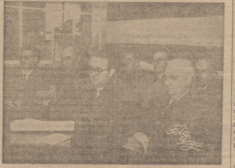
Nuestras primeras autoridades, en la presidencia del acto conmemorativo de la ley fundacional del Instituto Nacional de Previsión.