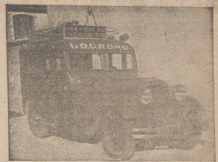
«HUDSON», 26 H. P., 6 cilindros, carrocería mixta, capaz para 14 asientos, con galería en la bota, con seis ruedas seminuevas. Propio para transporte de viajeros.