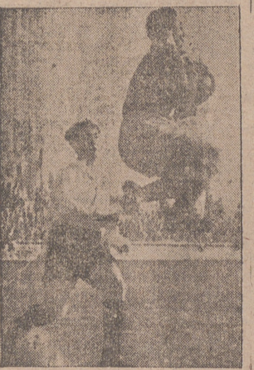
Una buena parada del portero de Tudela