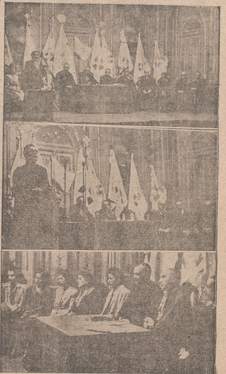
Ayer inició brillantemente sus tareas la I Asamblea Diocesana de Acción Católica. En el Teatro Bretón de los Herreros se celebró por la tarde el primer acto general, en el que hablaron la señora García Castañón, del Consejo Superior de Mujeres de A. C., y el R. P. Gürpil de S. J., momentos que recogen los grabados de Cortés Payá, así como un aspecto de la presidencia.