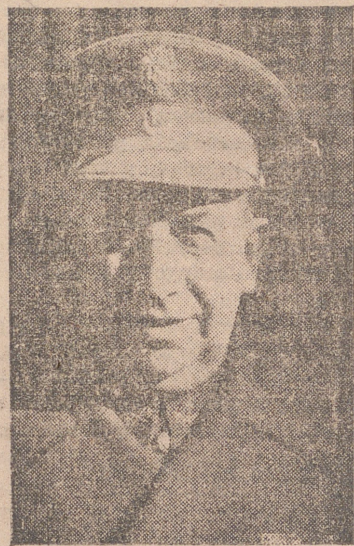
BIOGRAFIA DEL HEROICO TENIENTE GENERAL

Rápidamente se llenaron los pliegos que se colocaron en la entrada del domicilio, y de todas las provincias de España llegan incesantemente telegramas de los capitanes generales y jefes de guarnición.