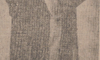
Abrigo de pago, con eibolina en tono oscuro. Lleva adorno de espumantes.

Para lavar pintura use un poco de soda en agua caliente, deje enfriar y lave sin frotar, deje secar la pintura junto con la suciedad.