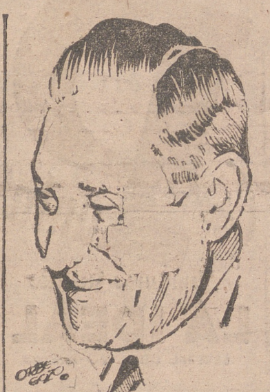
comuna, que en ningún caso debe evitar la crítica justa, saludable, objetiva y competente».

TÁNGER. — Están a punto de llegar a esta población los jefes y oficiales del Ejército belga, llamados a encargarse del mando de la Gendarmería de Tánger. Hasta ahora, estas fuerzas de Policía indígena venían siendo instruidas y mandadas por oficiales españoles, condecorados de la psicología marroquí y capaces de entenderse con los moros en su propia lengua. Este ensayo de régimen nuevo, que se trata de imponer a la ciudad de Tánger, sin consultarla, no cuenta en ella con partidarios entusiastas. Pero aún entre aquellos inclinados por razones políticas a juzgar con benevolencia el nuevo orden de cosas, será vista con curiosidad y escepticismo la entrada en funciones de estos oficiales belgas, dignísimos y competentes, sin duda, pero que, por ser totalmente extraños al ambiente y a la mentalidad indígena, han de tropezar con dificultades no sólo en el contacto con las tropas de su mando, sino en el desempeño de su misión propiamente policíaca. Ya que el 80 por 100 de la población de Tánger se compone de musulmanes que no conocen más lengua que el árabe o el español.