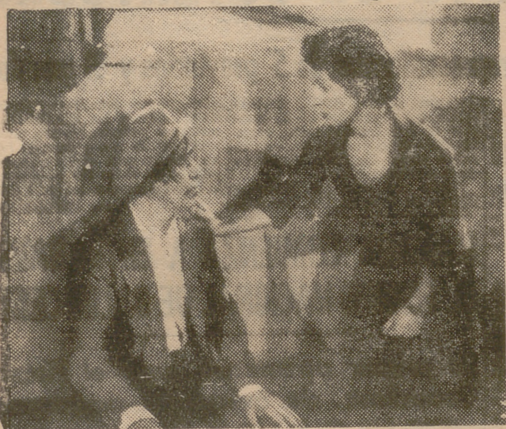
Danielle Darrieux y Francisco Bernal en una escena de "El torero", la verdad de nuestra fiesta nacional en una película de apasionante dramatismo. Presentada por Cifesa, "El torero" se estrena el lunes próximo en los cines Pompeya y Palace