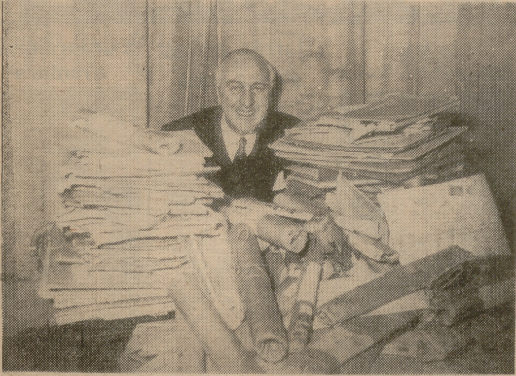
Autores musicales de las más diversas nacionalidades han enviado composiciones al concurso convocado por el Comité Olímpico Internacional para elegir el himno oficial. En la fotografía aparece el canciller de la organización, con los paquetes conteniendo las partituras llegadas a Lausana. Las más bellas notas y las más bellas palabras serán precisas para expresar la solemnidad máxima de las más puras manifestaciones deportivas, ahora en peligro de ser mancilladas por corrientes nuevas que van contra el espíritu olímpico.