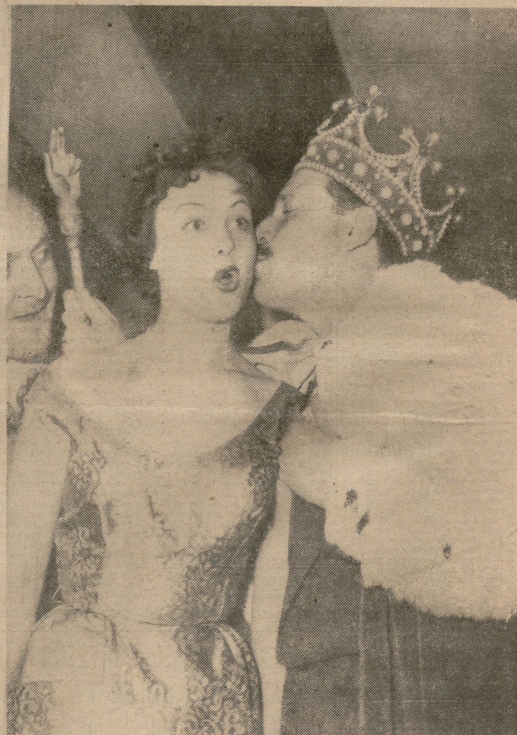
DE TU A TU Esta chica tan mona con su ¡Oh! de sorpresa en sus lindos labios, es nada menos que Miss Francia 1955, auténtica reina de belleza, que recibe un beso de otro monarca, del Rey de Camelots 1955, caballero a quien felicitamos cordialmente y le envidiamos esa manecita, a lo mejor de oro, utilísimo artefacto para llegarse a granitos irritantes situados en recónditos lugares de la espalda. Sí, le envidiamos.