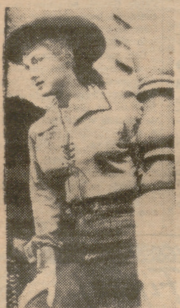
Virginia Mayo, en una de las escenas de la formidable superproducción de la prestigiosa marca R. K. O. Radio "Noche salvaje", una película llena de interés y emoción cuyo relato es impresionante por el verismo de sus escenas. El lunes próximo tendrá efecto el estreno de "Noche salvaje", en los cines Rex y Beatriz.