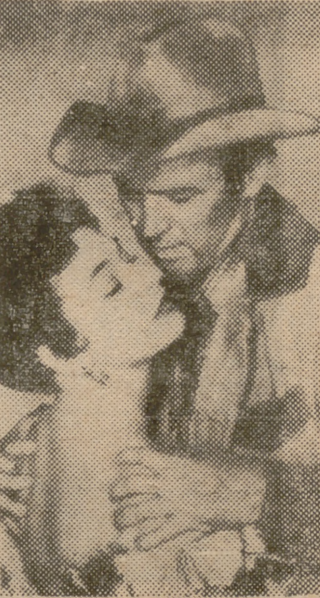
Ruth Roman y James Stewart, en un primer plano de la sobria superproducción de aventuras en technicolor "Tierras lejanas", película llena de escenas espectaculares y emocionantes. Presentada por Universal Films, "Tierras lejanas" se estrena hoy, sábado, en los cines Carlos III y Roxy A.