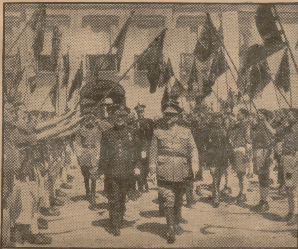
El Caudillo, acompañado del ministro secretario general del Movimiento, pasa revista a las centurias del Frente de Juventudes, en el acto celebrado hoy para hacer entrega a Su Excelencia del nombramiento y bastón de alcalde de Mostoles.