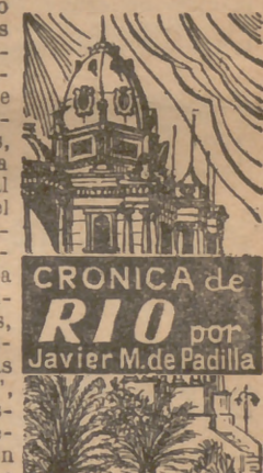
CRONICA de RIO por Javier M. de Padilla

Lo que si se puede asegurar de una manera categórica es que en Brasil todo lo español es producto, como principio, de una maravillosa expectativa que no se disimula. El Brasil admira a España y está deseoso de conocerla, aunque por desgracia no lo consiga muchas veces. España necesita producir muchas películas y exportarlas. Pero películas de verdad, como "Locura de amor", que descubran al extranjero el auténtico valor de la Raza, atargado en las conciencias de los públicos de otros países. Yo he visto llorar a la gente que asistía a la proyección de "Don Juan", en la última escena del film, porque aquel último: "... Don Juan Tanorio... ¡Español!", no era una frase folclórica de la escuela tímica de lo que no debe ser, sino el alma espontánea de lo hispano, con sus virtudes y también con sus defectos.