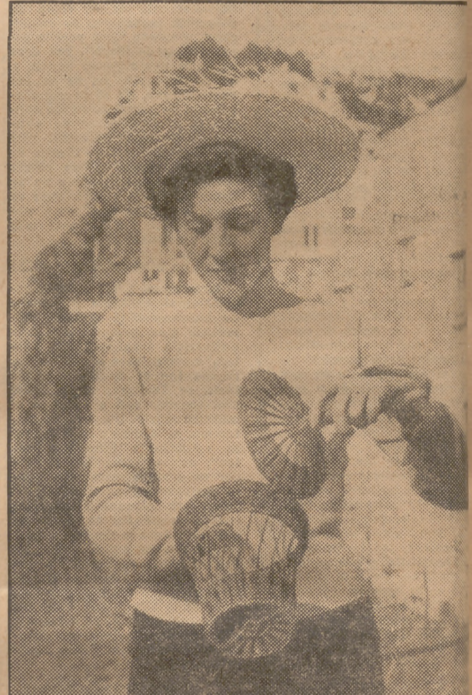
LA MODA EN CAPRI En nuestro país, esos administradores llevan las gitanas; pero en Capri, la italiana, refugio primero de Faruk y siempre playa de millonarios, los van a llevar este verano las elegantes, como pueden ustedes apreciar en esta linda muchacha. La cestita es un bolsito el sombrerito de paja es... un sombrero.