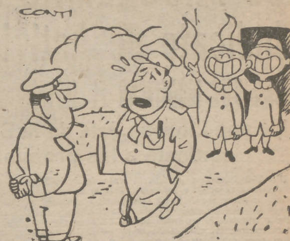
EN KAESONG, por Conti —¿Qué tal las conversaciones? —Cordialísimas e inútilísimas.