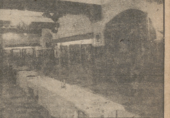
Una vista de la Exposición celebrada recientemente en Logroño con motivo del IX Concurso Provincial de Arte de Educación y Descanso y el de Artesanía. A este Certamen han concurrido muchos productores riojanos, presentando primorosas labores y objetos de esmerada confección.