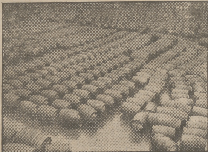
Millares de barriles de vino español se consumen anualmente en Suiza

Suiza ha consumido en el pasado año 200.000 hectolitros de vino español EL MERCADO AUMENTA DE DIA EN DIA