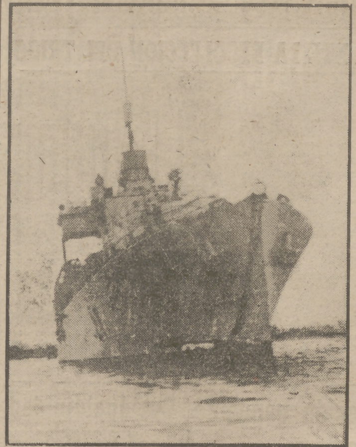
Esta es la corbeta egipcia "Nasz", que tanto revuelo ha causado al detener al navio inglés "Empire Roach" por sospecharlo portador de contrabando para Israel. A la derecha, el capitán de la nave egipcia, capitán de corbeta Abdel Moneim Bayoumi, al mando de la nave.