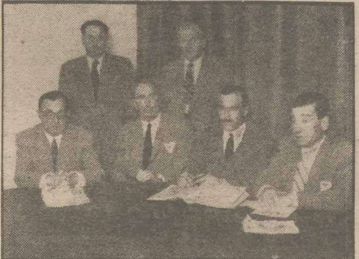
Los vocales nacionales del Círculo de Producción del Sindicato de Cereales se han reunido para tratar de la próxima campaña de la recogida de trigo y de la posibilidad de un aumento tributario y su repercusión en el coste de la vida.