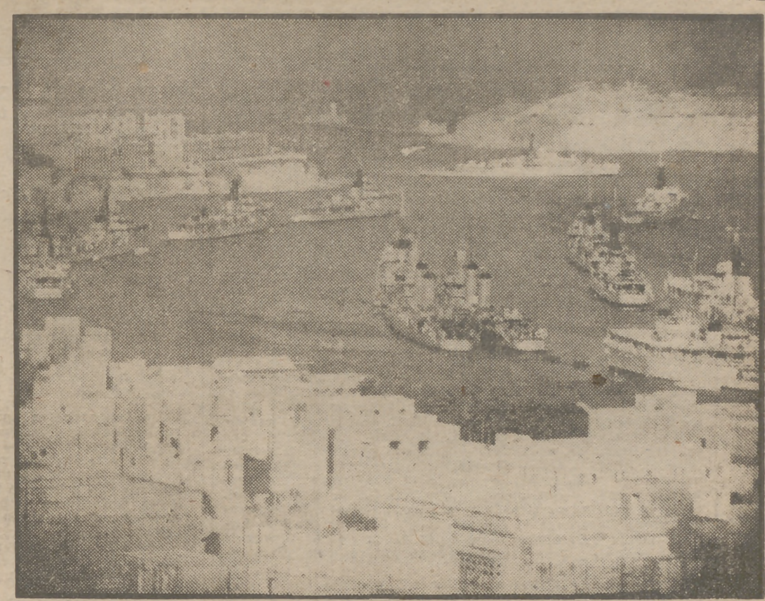
Las flotillas americana e inglesa se han reunido en la bahía de La Valette (Malta), base común de las operaciones combinadas angloamericanas en el Mediterráneo. A la izquierda pueden verse los cuatro destructores británicos que salieron de Malta con rumbo a Akaba y Aden, a raíz del incidente provocado al ser interceptado un navío inglés por una corbeta egipcia.