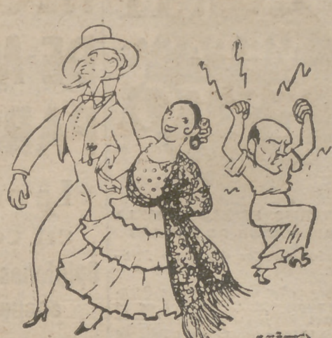
CELOS MAL REPRIMIDOS, por Castany