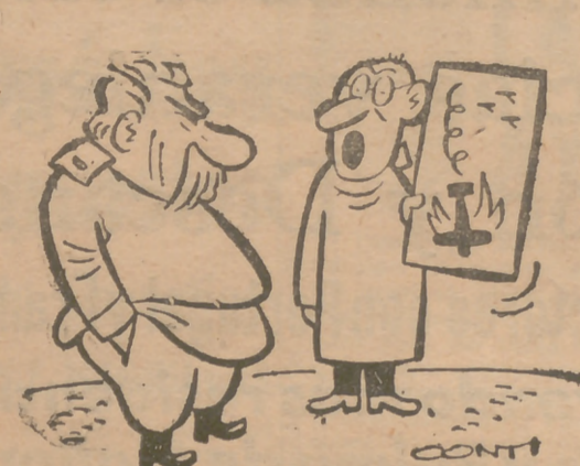
CAMPO DE MANIOBRAS

—¡No podré ir a la oficina esta mañana, señor gerente! ¡He pasado una noche intranquila oyendo Barcelona!