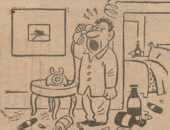
EL SEGUIDOR DE HOCKEY

(Por Conti, de "La Prensa", de Barcelona.)