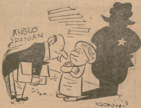
LA MALA SOMBRA

—En vista de las circunstancias estamos dispuestos a negociar.