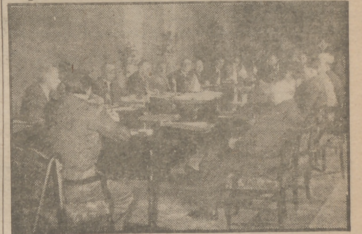
Los delegados de los países que asisten al Congreso Internacional de Panadería, durante una de las sesiones.