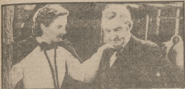
La encantadora actriz Bárbara Stanwyck y el formidable actor de carácter Barry Fitzgerald en una escena de "California", gran superproducción del cine estadounidense, que Cifesa presenta hoy, lunes en el cine Rialto.

Hoy, lunes, estrena Cifesa la más grandiosa superproducción del Oeste, rodada en technicolor, titulada "California", e interpretada por Bárbara Stanwyck y Ray Millan. Estos dos maravillosos artistas, que a tan magníficas interpretaciones nos tienen acostumbrados, han encontrado en "California" ocasión propicia de mostrar su calidad artística al encarnar dos personajes de antología que forman la pareja central de este film.