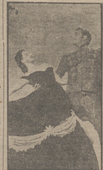
He aquí a la bellísima Yvonne de Carlo y al apuesto galán David Bruce en un primer plano del magnífico film "Salomé la Embrujadora", que Distribuidora Chamartín presentará en breve en uno de los cines más lujosos de la Gran Vía madrileña.

En este film, que trata de las aventuras de un joven guerrero en tiempos de César Borgia, hemos utilizado artistas de varias nacionalidades. Se puede decir que nuestra compañía era una "Naciones Unidas" en pequeño, pues casi no hubo país de Europa que no tu-