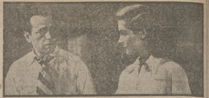
Humphrey Bogart y Lauren Bacall en una escena de la apasionante superproducción Warner Bros "Cayo Largo", que hoy, jueves, se estrena en el cine Avenida. Existe gran expectación ante el estreno de este espectacular film, el más logrado de los realizados hasta hoy de ambiente de "gangsters".