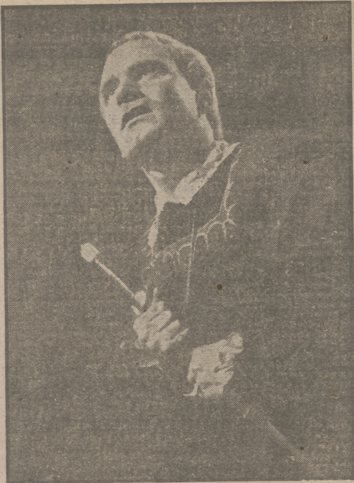
Jamás fué lograda—en sus trescientos cincuenta años de existencia—una representación semejante de "Hamlet" como la que nos ofrece Laurence Olivier en su extraordinaria película.