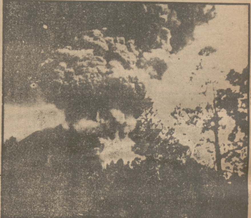
El tercer cráter del volcán de San Juan, en el que se aprecia el denso humo en forma de gigantesca coliflor que resaca en una crónica nuestro corresponsal.