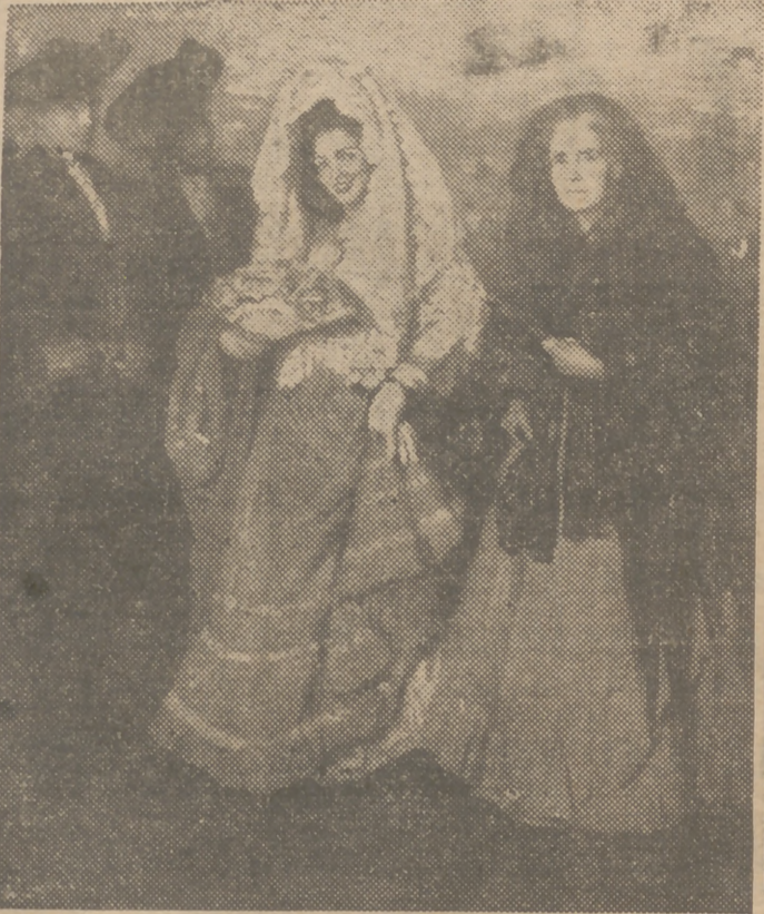
"Doña Paca y su prenda", óleo de Soria Aedo.