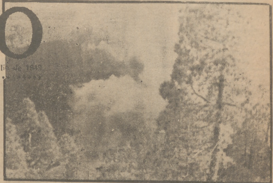
Fotografía tomada desde el Pico Vergejo dos días antes de que éste desapareciera, por nuestro corresponsal en La Palma.