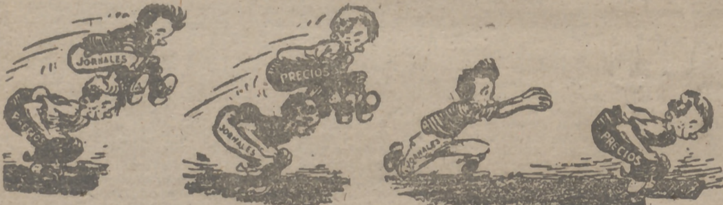
"Los niños juegan al burro", historieta recogida del "New York times".