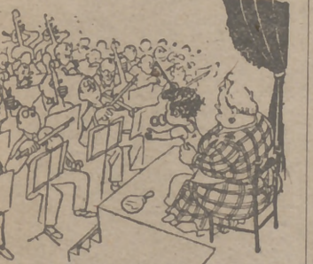
El futuro director de orquesta (De Castany, en "El Correo Catalán".)