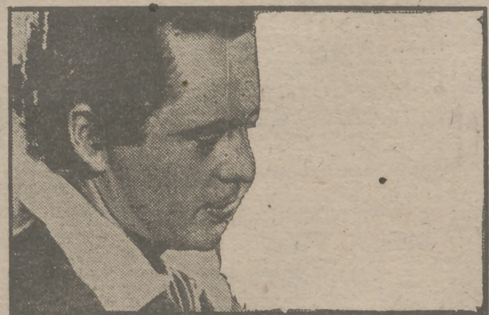
Larry Parks en un primer plano del film de aventuras, en technicolor, "El espadachín", que será presentado por la Columbia el lunes próximo en el cine Capitol.