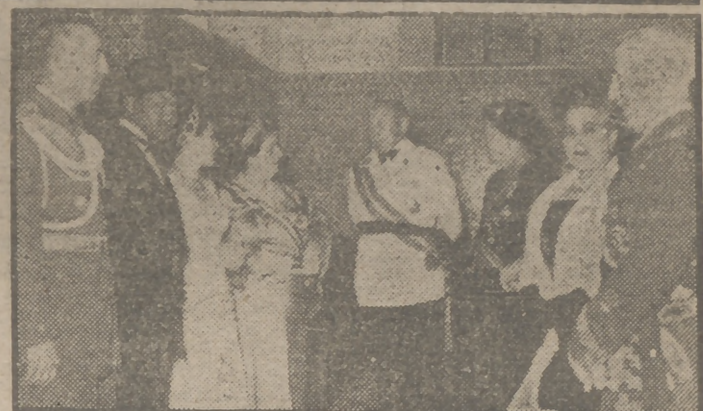
Acompañado del alto comisario, teniente general Varela, Su Alteza Imperial el Jalifa contempla uno de los hermosos ejemplares que el Ejército de Marruecos le ha regalado con motivo de su próxima boda. Vemos en otra foto otro hermoso caballo, regalo también a Su Alteza Imperial, y en la de abajo, algunas de las personalidades que asistieron a la cena de gala.

muerto de Muley el Mehdi, el esclarecido hijo de Muley Ismail.