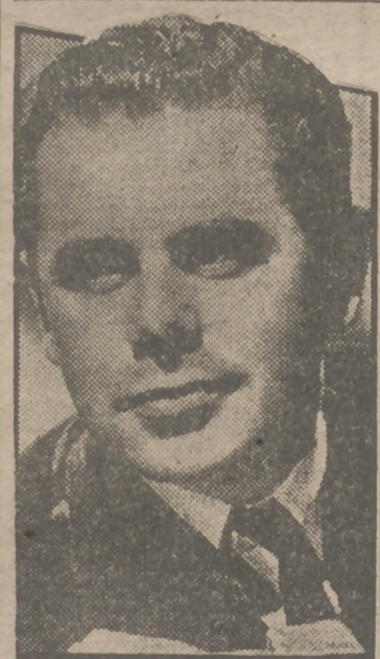
Glenn Ford, el galán hoy en boga en Hollywood, intérprete inolvidable de "Gilda", logra la más feliz de sus interpretaciones en "Paula", obra maestra del séptimo arte, que con éxito ascendente de público ha entrado en su quinta semana de proyección en los cines Proyecciones y Palacio del Cine.

argumentista, director y actores han sabido captar los ángulos humorísticos y agudos de la vida más natural, y por ello más interesante, la originalidad genial de esta película llega profundamente al lugar de nuestro pensamiento en el que siempre hemos querido encontrar inspiración y agudeza para interpretar la vida que nos parece monótona. Vean "¡Viva la vida!" desde el prisma de sus amarguras, de su optimismo, de sus neurosis o de su alma sana; vean como quien y recibirán un saludable baño de optimismo, de sonrisas y de originalidad fluida, transparente y clara como las sonrisas de sus personajes.