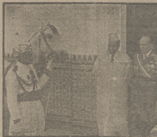
TETUAN, 4. (De nuestro enviado especial, Epifanio Tierno.)

¡Pregonero!... ¡Llama, llama fuerte a las puertas de las veinticinco mezquitas de Tetuán! ¡Golpea, golpea recio en los umbrales de las treinta zawiás y congrega a los estandartes de sus cofradías! ¡Que los quince predicadores del viernes canten el regocijo de los principales! ¡Que los cincuenta almuedanos echen al aire azul de la alborada el poema bendito del amor!... ¡Se casan dos Emires de la Casa Real y es Tetuán en este instante la corte de su reino! ¡Tetuán abre de par en par sus puertas a la Historia para que pase la historia de un día!... ¡Pregonero, repite en cada esquina del mundo tu pregón! ¡Es alegría, pregonero; alegría de España en esta doble primavera de su segundo Califato: Córdoba y Tetuán!