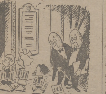
—Fíjate, amigo; me está dando vergüenza ser director de orquesta a mis años (De Conti, en "La Prensa").

049 ICA arlo ra n espe ntecario, evas. s, como una ver- cabezado a forma "esplén- mbrados ad como ree. Los on algu- ocer casl ña: las , Tama- Highlo- André e. Confío e exten- uras fe- an ad- on este ecido a calidad, tras, de e técnica de velada delicade- inecon- la gran el mun- narse en ra. Decid ecute un s rusa o oumano- arte, las ico fran- o de los s—escri- tra gran ova: "la st d'una discreto donte pas s". Pues mente, el que Ro- de las ndo. Co- r de ha- o común epara de cia radi- que apli- odigiosa. facilidad entes, el y movi- conjunto, rable. Su nsa—esta isible en —, como descon- confir- pues ana, han o myste- o prena- merica- de haber ción ro- manera anova. Si o en una el mag- dos per- es como "paso" os es- se hizo su fuer- "entre- e" es el reper- ducto del ico tran- treno es lota Gri- o se sa- leyenda Gautier, balleo- erdió la literatos Cocteau La bal- nizar dos s, como eña, en e fantas- undo, en "pas de pasos de oumano- ara Vill- director.) i nar sin ez, el di- acia y el condujo sin duda ado, que de Vega. fecto en asi decir ello Da- hermosa, e he vis- como, ilats" de te otoño en San s" par- ían por s, y por a idea RDEJO no pen- ario al rdo tuvo carga de Mari-Loh ca Nue-