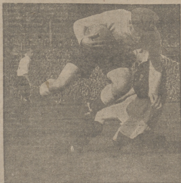
El portero del equipo nacional inglés, Frank Swift, se hace con un balón que intentaba rematar el extremo izquierda escocés, Laurie Reilly, durante un avance de la delantera escocesa en el encuentro jugado entre Inglaterra y Escocia, y que el equipo escocés se adjudicó por tres tantos a uno.