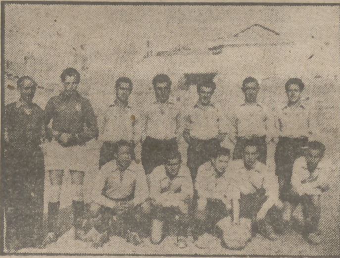
El conjunto del Grupo de Empresa de Confecciones Ruano, uno de los más destacados equipos del primer grupo de tercera categoría en el torneo sindical.