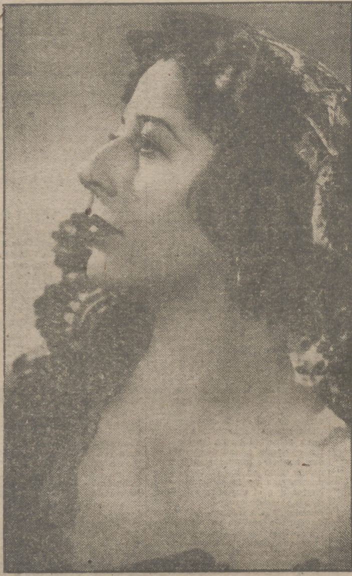
LA TONADILLA ESPAÑOLA

La letra es de QUINTERO y LEON La música, del MAESTRO QUIROGA