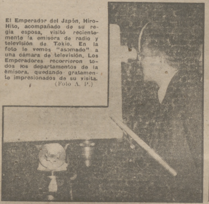
El Emperador del Japón, Hiro-Hito, acompañado de su regia esposa, visitó recientemente la emisora de radio y televisión de Tokio. En la foto le vemos "acomodado" a una cámara de televisión. Los Emperadores recorrieron todos los departamentos de la emisora, quedando gratamente impresionados de su visita.