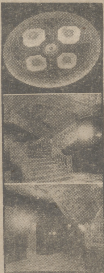
Detalles de la decoración del teatro Lope de Vega.