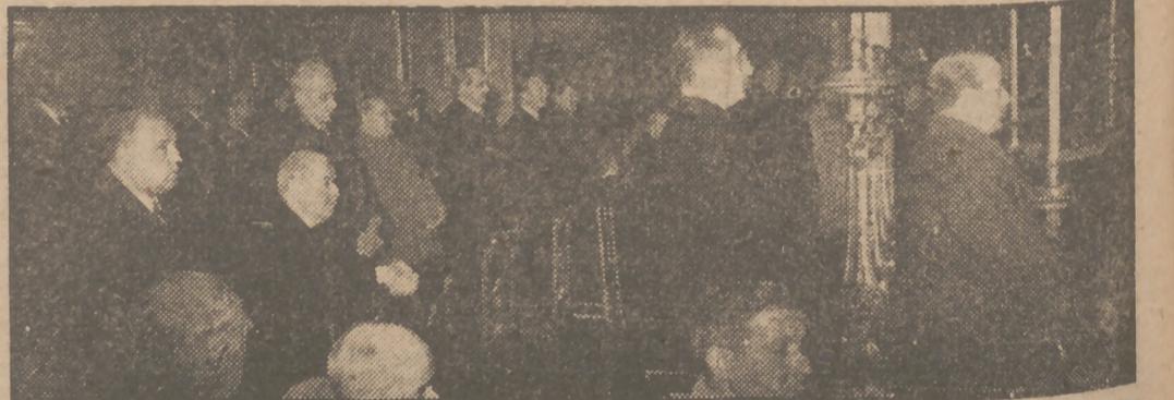
Por el alma de don Miguel Primo de Rivera se han celebrado hoy en San José solenes honras fúnebres, con asistencia del presidente de las Cortes y los ministros del Ejército, Justicia, Aire y Obras Públicas.