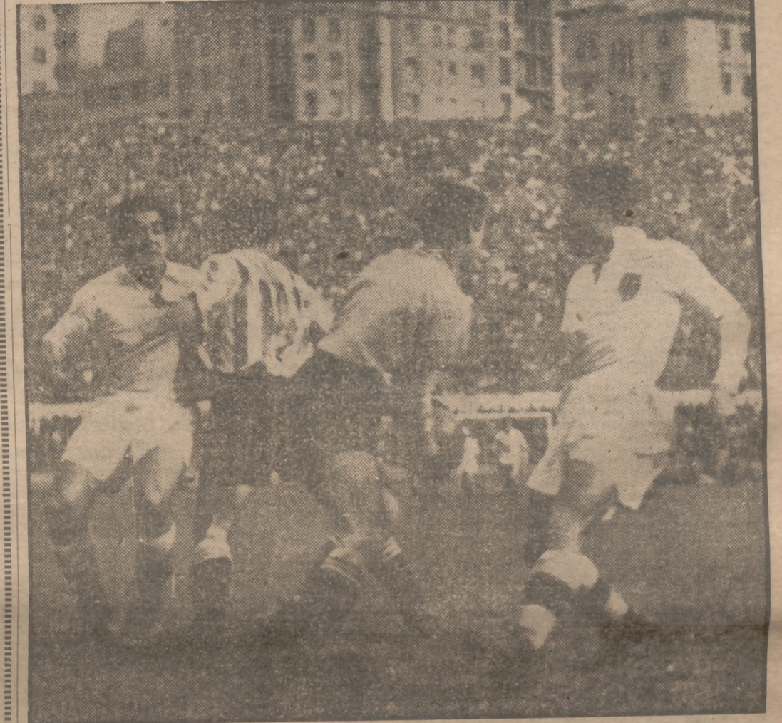
Con cielo encapotado y fuerte viento, el público se dirigió al Estadio Metropolitano, con la esperanza de ver un buen partido entre el Atlético y el Valencia y la ilusión de saborear la ansiada lluvia. Pero ni llovieron las aguas ni la gente llegó a entusiasmarse con el juego que vio. Tarde perdida para todos, excepto el Valencia, que se acerca amenazador al Barcelona, partido ayer en San Mamés. El partido tuvo una primera parte de ventaja valenciana y una última media hora de reacción madrileña, en la que se llegó al empate final después de "brillar" en el marcador un dos-cero a favor del Valencia.

Se adelantó el Valencia, pero el Atlético logró darle alcance