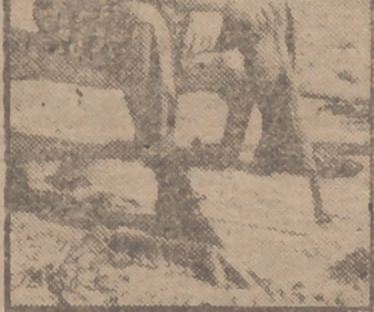
Joe Louis, el campeón del mundo de los pesos pesados desde 1937, descansa en Miami. Veinticinco veces ha puesto en juego su título en quince años y ha ganado más de un millón de libras esterlinas.