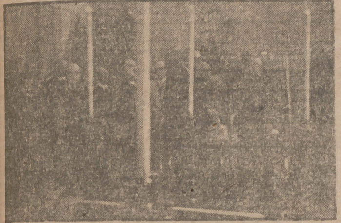
En la Iglesia parroquial de Santa Teresa y Santa Isabel se han celebrado...