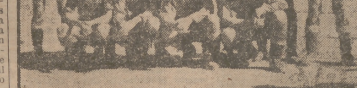
Equipos del Grupo de Empresa de La Central, que figura en primer lugar en el torneo de segunda categoría de Educación y Descanso.