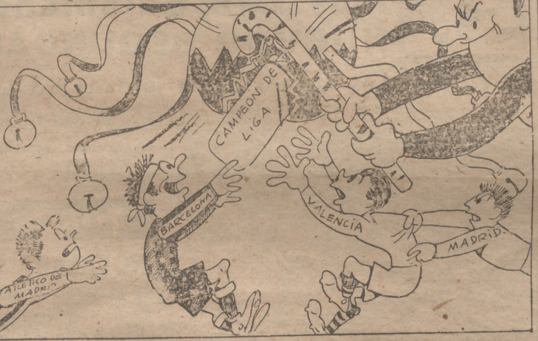
La gran piñata de la Liga.