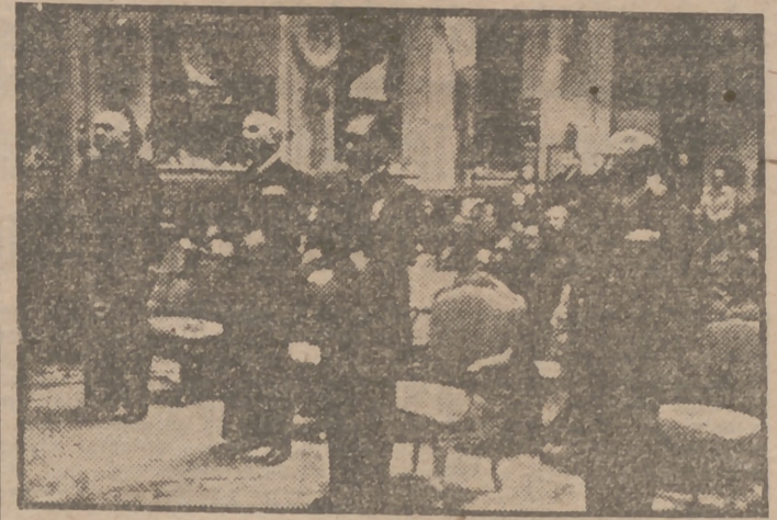
En el Ministerio de Marina se conmemoró el XI aniversario de la heroica gesta del crucero "Baleares"...