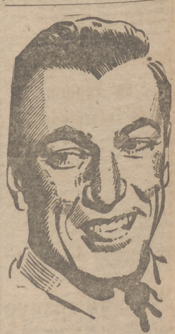
Gary Cooper, protagonista de la superproducción de la Paramount, en tecnicolor, "Por el valle de las sombras", que ha entrado en su séptima semana de proyección en el cine San Miguel