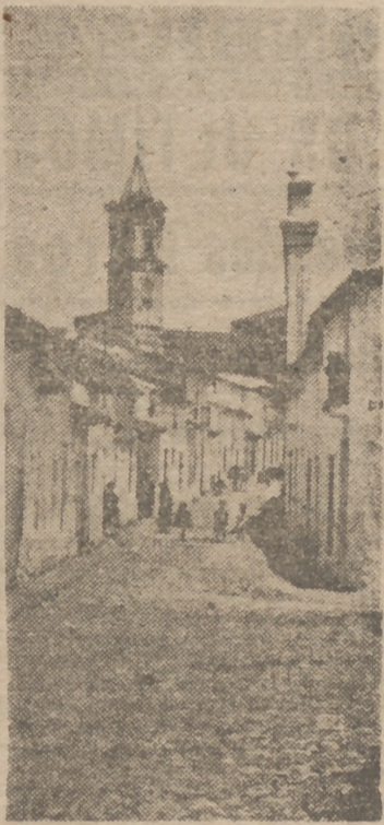
Una típica calle orubense, situada en el barrio de pescadores.

Los acuerdos y propuestas aprobadas se enviarán para su aprobación definitiva a la superioridad. (S. I. S.)