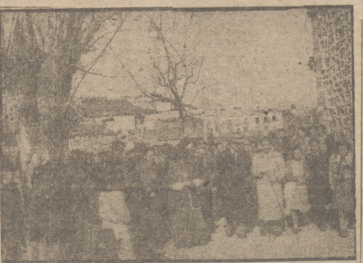
El templo parroquial de Navalunga (Avila), que se derrumbó hace tres años, ha sido reconstruido por la Junta Nacional de Reconstrucción de Templos del Ministerio de la Gobernación. En la foto, el obispo de la diócesis, el gobernador civil y otras autoridades dirigiéndose al templo para el acto solemne de la bendición.