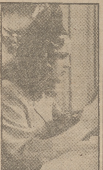
Sarita Montiel en un primer plano de la jocosa película "El misterioso viajero del Clipper", que mañana, jueves, se estrenará en el suntuoso cine Coliseum

de presuntos asesinos y cómplices, que no son más que pacíficos ciudadanos, hacen de "El misterioso viajero del clipper" una agradable película, cuyo estreno se anuncia para mañana, miércoles, en el cine Coliseum.