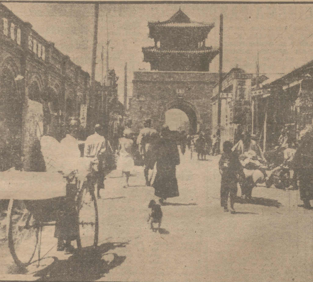
Esta vista de Tientsin fué tomada antes de que las fuerzas comunistas iniciasen la ocupación de la importante ciudad del norte de China. Después toda la población sufrió un intenso y continuo bombardeo de artillería, que causó numerosas bajas civiles, hasta que el 15 de enero cayó Tientsin en manos de las tropas comunistas, que se van adueñando de Asia ante la expectación puramente contemplativa del llamado mundo occidental.