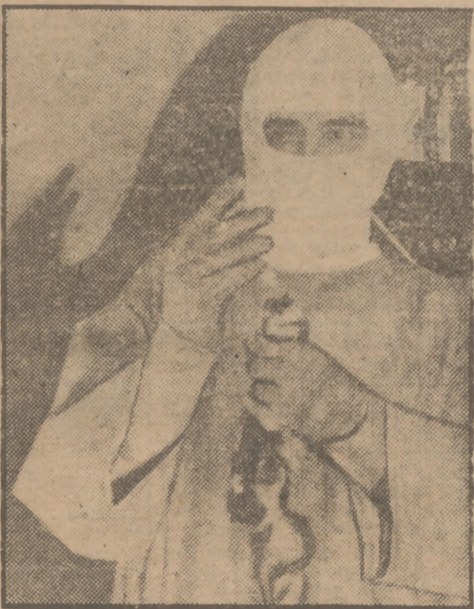
Una muestra del poder de contagio de la gripe lo vemos en este grabado, que muestra las precauciones que deben adoptarse para inocular la enfermedad a un hurón.

Declaraciones del doctor Clavero del Campo