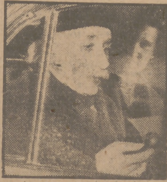
En el automóvil que le condujo a su casa de Princeton, el doctor Einstein abandona el Hospital Judío de Nueva York, donde sufrió una operación quirúrgica.

—¿Es muy avanzada nuestra legislación social?, cabe preguntarse.