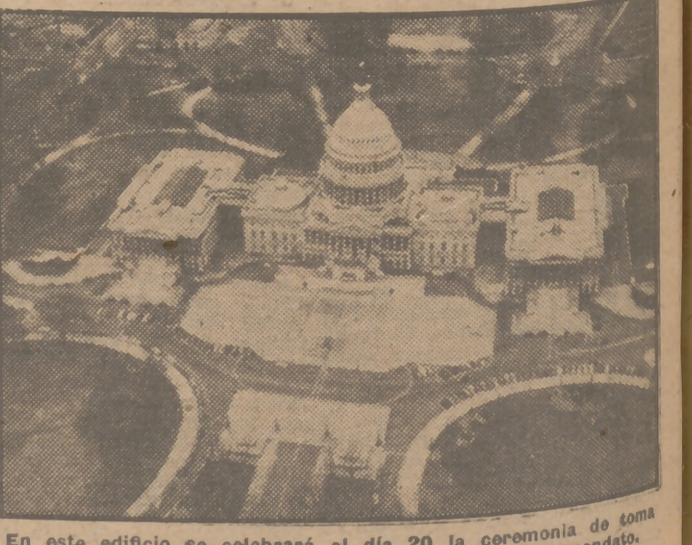
En este edificio se celebrará el día 20 la ceremonia de toma de posesión del Presidente Truman para su nuevo mandato.