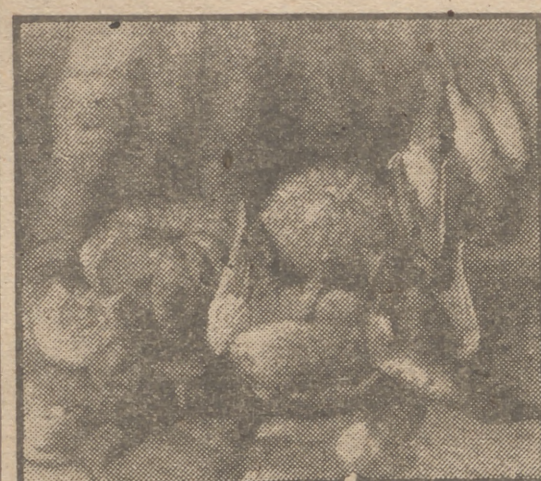
"Bodegón", por José María del Río Moreno

—¿Y por qué el arca? ¿No hay algo mejor? Pero no crea que, como médico, voy a referirme al aceite de hígado de bacalao y a las vitaminas. No hay más grasa para los pintores que la de sus óleos ni más vitaminas que la de sus pigmentos, y que consiste en no aludir a la acuarela, pues la acuarela en esta su segunda Exposición merece una concretísima atención.