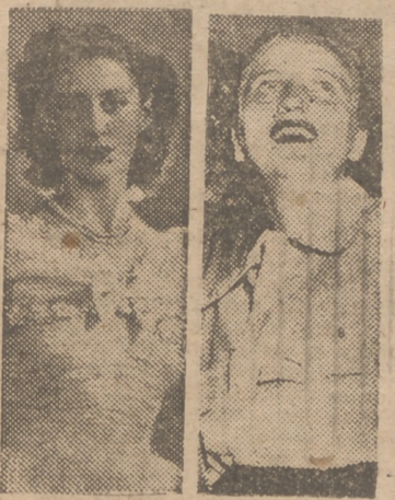
Margaret, hija menor de los Reyes de Inglaterra, y Margaret, hija única del Presidente Truman. (Hallará usted este interesante reportaje en las páginas centrales de este número.)