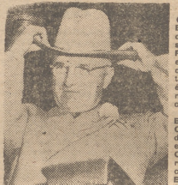
Este no era un problema federal, sino de los Estados, y, por lo tanto, podía evitarse una dura lucha adoptando ese camino. La respuesta del Presidente Truman fue breve y categórica.