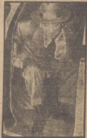
FRED M. VINSON

Truman tuvo que elegir entre sacrificar a Marshall o enviar a Fred Vinson a Moscú para tratar directamente con Stalin sobre el bloqueo de Berlín