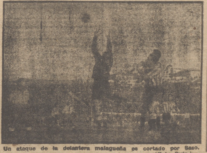
Un ataque de la delantera malagueña es cortado por Saso.