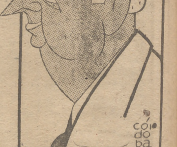
EL CABALLERO AUDAZ

—Espere usted—me dice—, y me dedica un tomo. No quiero