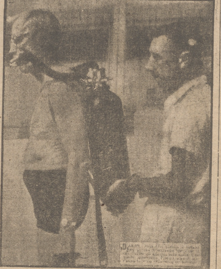
El profesor Piccard no pudo realizar la inmersión tanto tiempo proyectada por registrarse una avería en el batiscafo, que permitía la entrada de agua, viéndose obligado el profesor a renunciar, por ahora, al experimento. En la fotografía se ve a Piccard adaptándose el aparato de respiración artificial antes de entrar en el batiscafo. El dibujo da idea de la experiencia que se intentaba.

El célebre profesor belga-suizo Piccard, ha desistido de su excursión submarina. Inopinadamente comunicó su resolución a las autoridades de Dakar. En una prueba efectuada días antes, la carga de lastre se desprendió, cayendo sobre la cabeza del hijo de Piccard, afortunadamente sin consecuencias graves. Se decidió después un lugar más propicio a la sumersión: la bahía de Santa Clara, donde la profundidad alcanza a 2.000 metros.