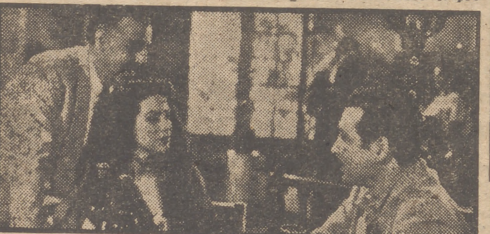
María Félix, Fernando Soler y Tito Junco en una escena de la excepcional película "Que Dios me perdone", que hoy, Jueves, estrena el majestuoso cine Gran Vía.

Cuatro mil "extras" tomaron parte en esta magnífica producción. Fueron contruidos cincuenta y ocho escenarios. Las escenas varían desde una lujosa mansión de multimillonarios hasta un humilde albergue al lado del río. Toda clase de catibos de tiempo figuran en este film. En él se encuentran representadas una tormenta de agua y otra de nieve, filmadas con absoluto realismo.