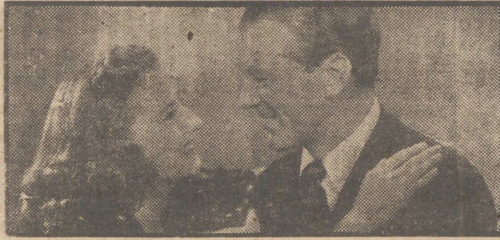
Barbara Stanwyck y Gary Cooper en una escena de "Juan Nadie", film que el lunes próximo será presentado por Exclusivas Floriva en el cine Avenida.

La personalidad artística de María Félix, la más bella actriz de habla española, vuelve a nuestras pantallas en su más magistral creación: "Que Dios me perdone", de Filmex, presentada ante el público hispano por la renombrada Hispanmax en el majestuoso cine Gran Vía. De acontecimiento artístico se ha calificado este estreno. "Que Dios me perdone" valló el ser seleccionada para su presentación en el Certamen Hispanoamericano de Cinematografía y valló al magnífico Tito Junco el pre-