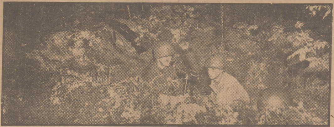
No se trata de una fotografía de la pasada contienda que por error haya saltado a estas páginas desde los arcanos del archivo. La escena es de hoy, y sus protagonistas dos soldados norteamericanos de los muchos que participan en las maniobras realizadas en los alrededores de Berlín, donde, por otra parte, la paz es bastante relativa.

José de Calasanz, hace ya tres siglos, implantó la enseñanza gratuita para la juventud