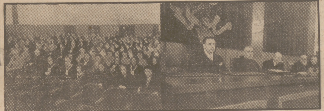
El ministro de Asuntos Exteriores y el Padre Perantoni, O. F. M., han presidido hoy el acto inaugural del Congreso Asuncionista Franciscano español.