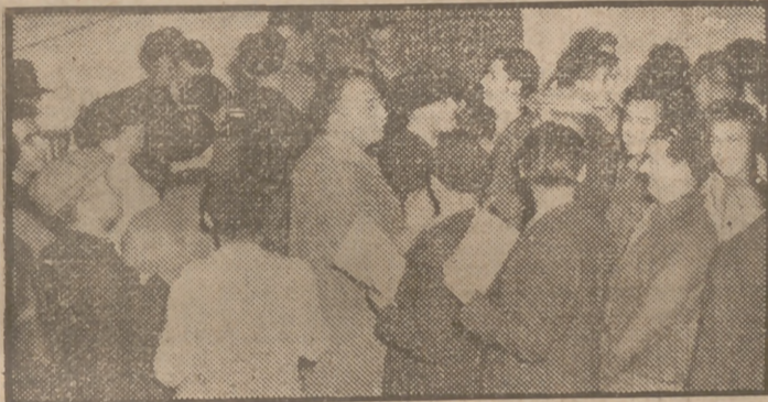
El Gobierno francés dirigió un llamamiento a los conductores voluntarios para facilitar el transporte de la población de París, una vez paralizados el Metro y los autobuses por la huelga de la C. G. T. Estos conductores recibirán 600 francos diarios. En la fotografía, un grupo de estos voluntarios momentos antes de comenzar su tarea. Ahora ya ha sido dispuesta por los dirigentes la vuelta al trabajo, tanto en el Metro como en los autobuses.