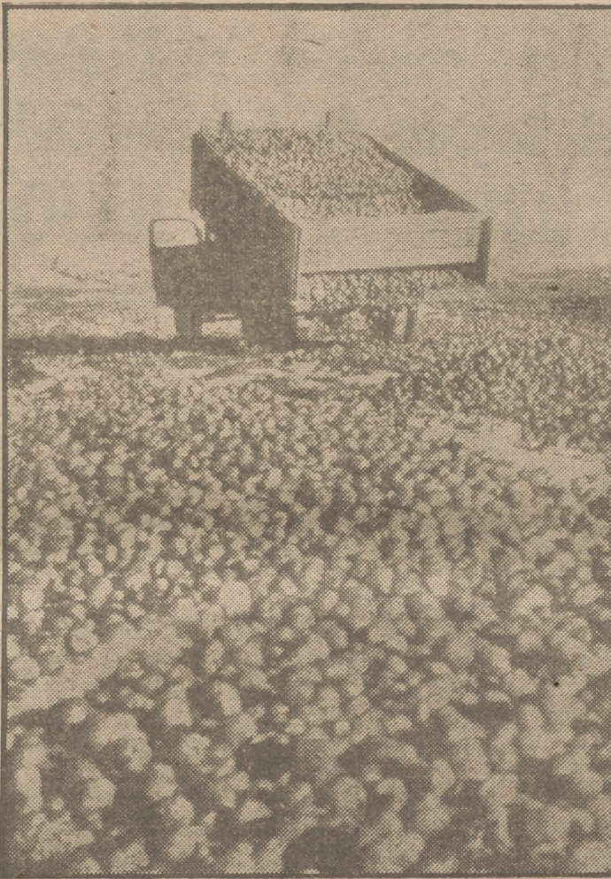
El exceso de cosecha de patatas en algunos Estados ha obligado en zonas fértiles de Norteamérica a dedicar el preciado tubérculo como fertilizante. He aquí un campo de labor cerca de Grand Forks, Dakota, cubierto de patatas.