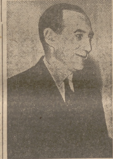
Beck, uno de los jefes de la conjura contra Hitler en la que estaban complicados casi todos los generales alemanes.

sonal de los dirigentes de los dos países y a la colaboración de los jefes militares.