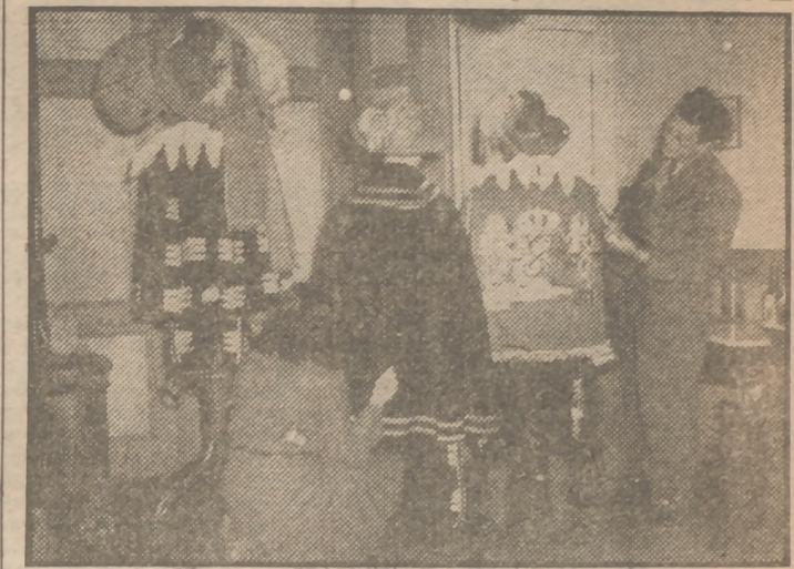
En Soestdijk (Holanda), el nacimiento de un nuevo príncipe es anunciado tradicionalmente por heraldos a la antigua usanza. Con motivo del nacimiento del cuarto vástago de la princesa Juliana y el príncipe Bernardo se dan los últimos toques a los trajes que han de usar los heraldos de Soestdijk.