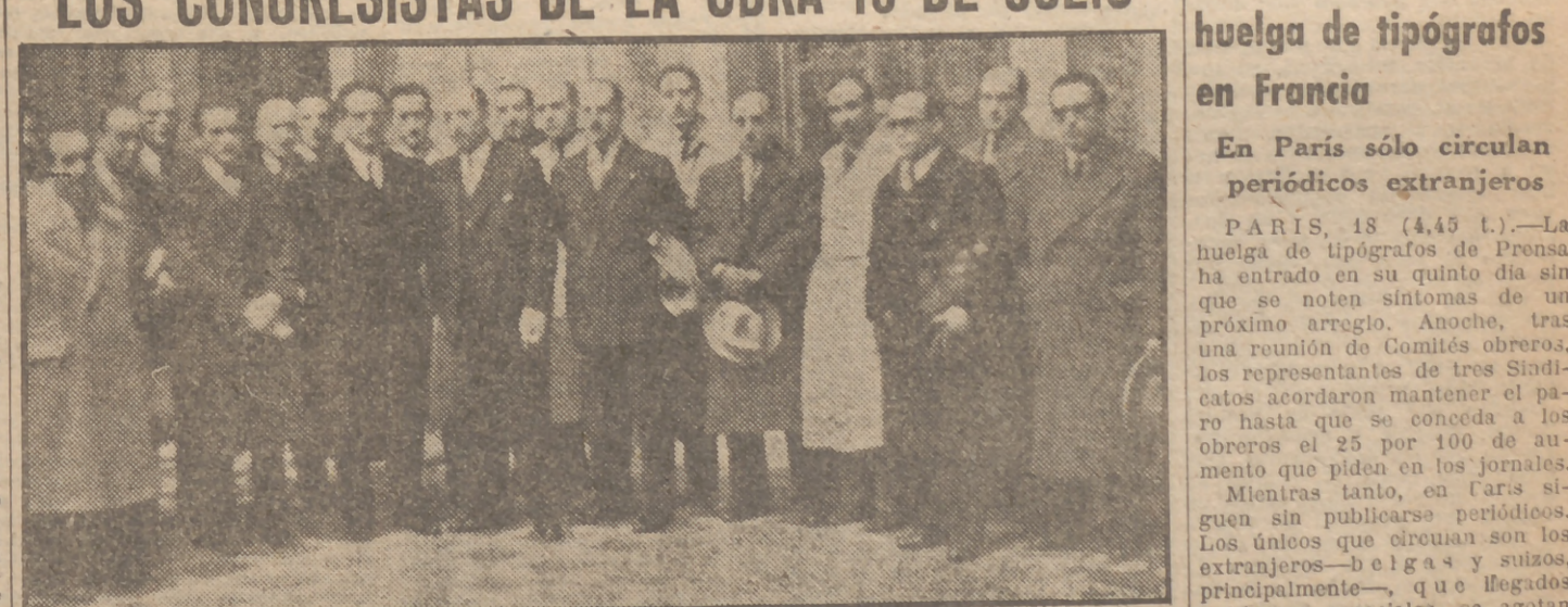
Una Comisión de asambleístas del Congreso Nacional de Servicios Sindicales del Seguro de Enfermedad y del 18 de Julio fueron recibidos hoy por el alcalde, conde de Santa Marta, con quien visitaron las dependencias municipales. (Información en página 3.)