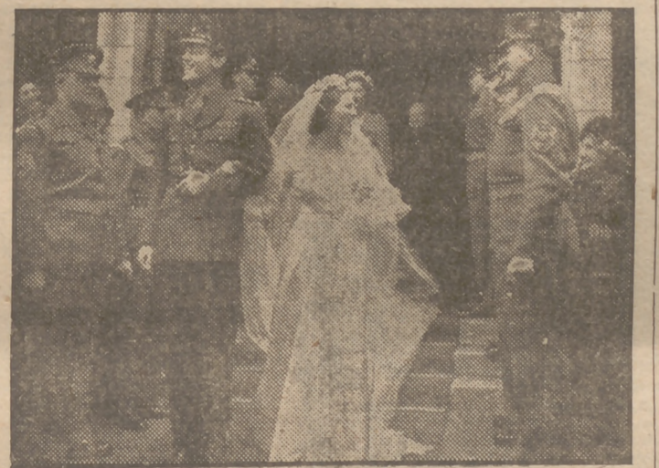
Terminada la ceremonia de su enlace, Mary Churchill y el capitán Soames abandonan la iglesia de Santa Margarita, seguidos de sus padrinos. Al fondo se ve a Mr. Churchill, padre de la desposada.