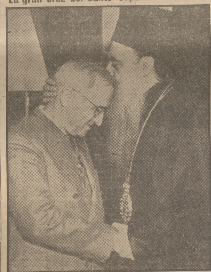
El Presidente Truman recibió de manos del reverendo Athenagoras, arzobispo de la Iglesia ortodoxa griega en América, la gran cruz del Santo Sepulcro "por su gran labor cristiana". Después de imponerle la preciosa condecoración, el arzobispo besó en la frente al Presidente de Estados Unidos.