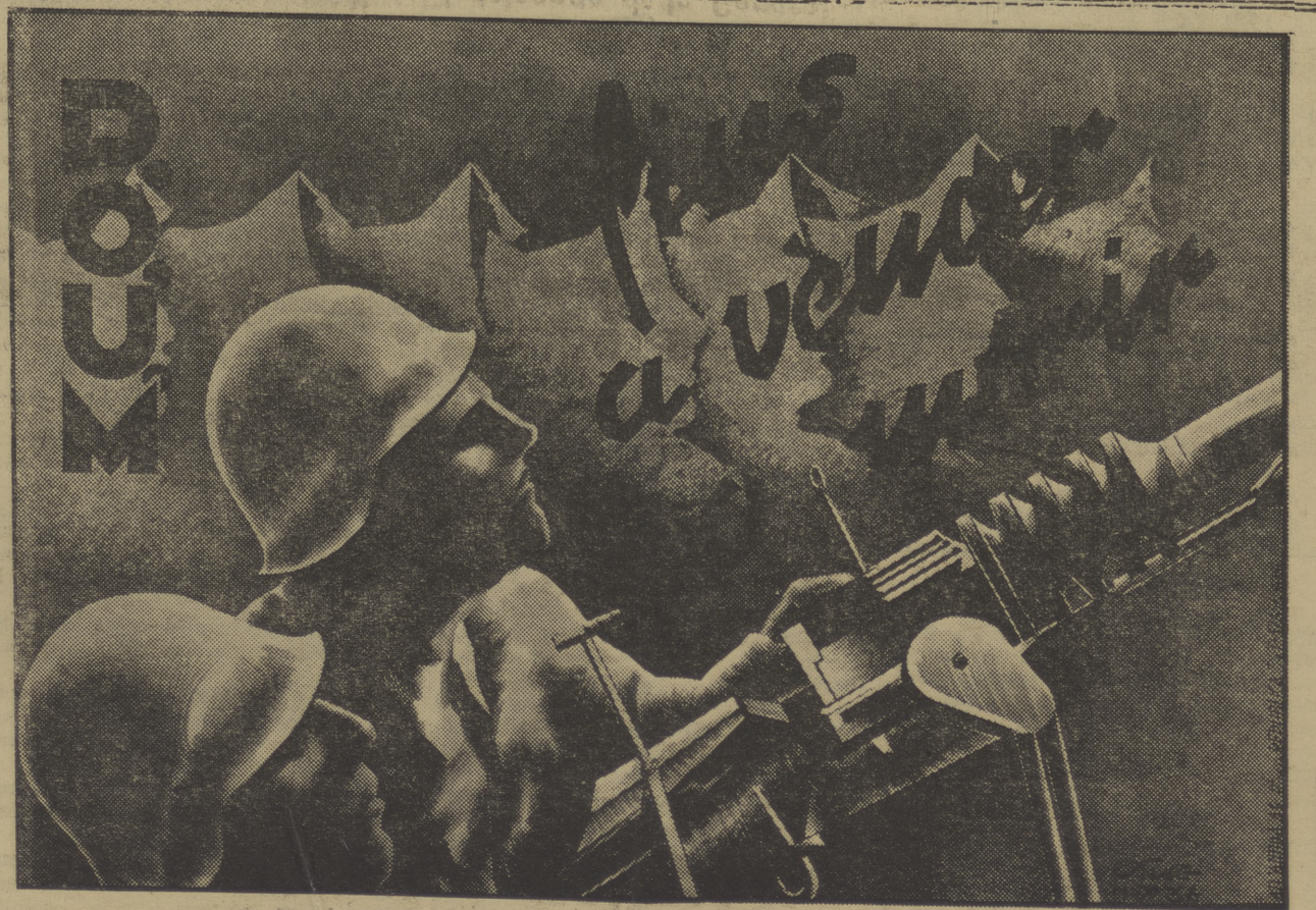
Ha aparecido un nuevo cartel del P. O. U. M. En él está impresa la consigna «Vencer o Morir». Consigna que debe hacerse en la oficina de Propaganda del P. O. U. M., y regirán las mismas condiciones que en los demás. El mismo cartel ha sido hecho en lengua castellana.

Hemos ido esta tarde a Tierz, casi a Huesca. Desde nuestras posiciones, aún no (Continúa en 7.º pág.)