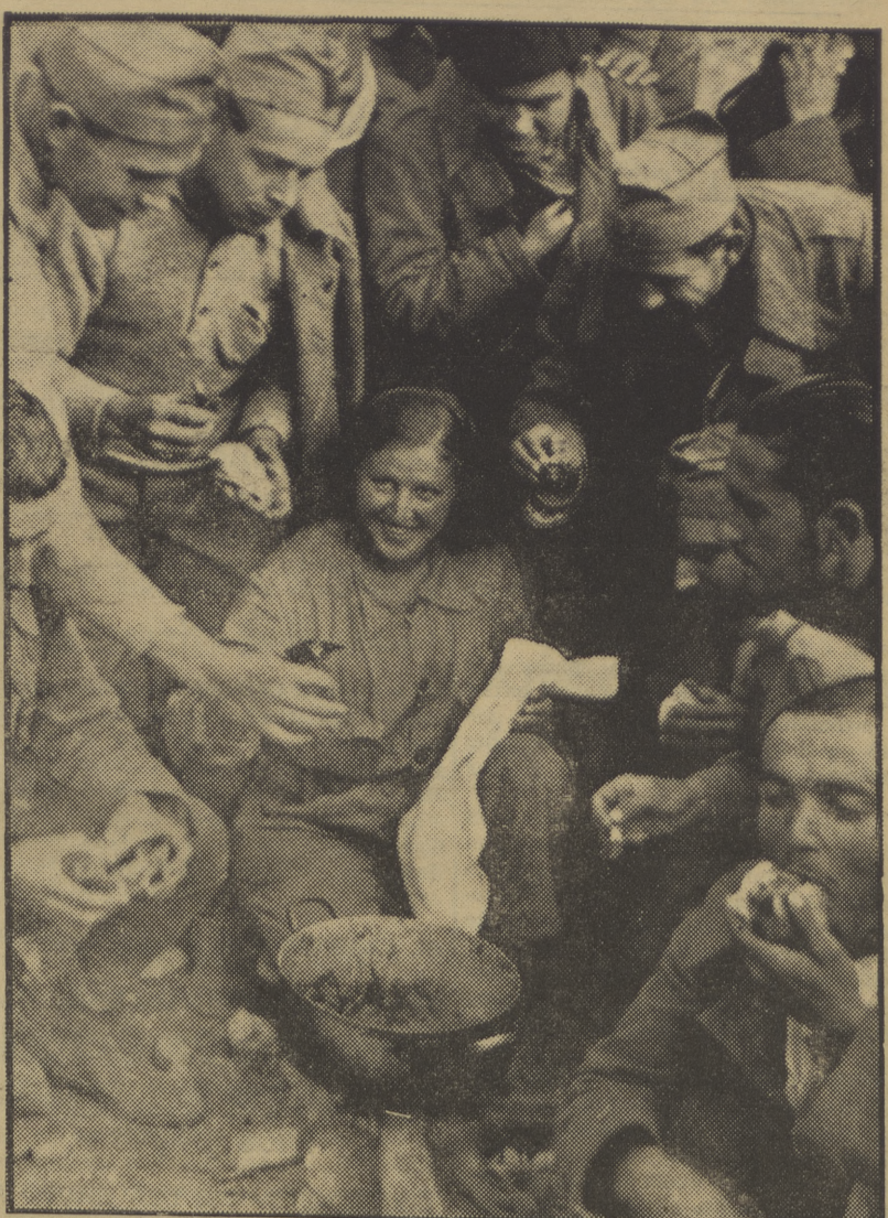
EN EL FRENTE DE TERUEL. — Esta simpática miliciana reparte la comida a los valientes milicianos que operan en este sector

E. C. P. - 42 METROS EMISIONES DIARIAS De 6'00 h.-6'40, en español. De 6'40 h.-7'00, en inglés. De 7'00 h.-7'20, en alemán. De 7'20 h.-7'40, en francés. De 7'40 h.-8'00, en italiano. LUNES, MIERCOLES Y VIERNES De 8'00 h.-8'20, en holandés. De 8'20 h.-8'40, en ruso. MARTES, JUEVES Y SABADO De 8'00 h.-8'20, en esperanto. De 8'20 h.-8'40, en español. CADA DIA De 8'40 h.-9'00, en español. Oficinas de RADIO P.O.U.M.: Rambla de los Estudios, 10. Teléfono 11350