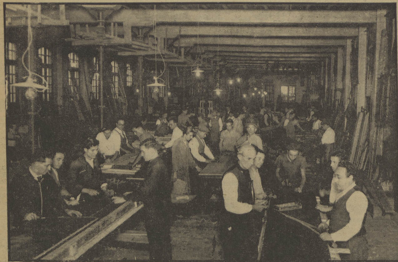
Aspecto de uno de los talleres de este convento. Se puede apreciar perfectamente las pésimas condiciones de higiene que reúne. Esta fotografía ha sido hecha a primeras horas de la tarde y las luces tienen que estar ya encendidas, tal es la poca luz que entra en él