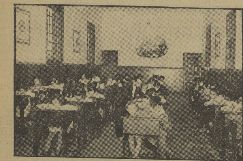
Las antiguas aulas, malolientes y de paredes de tonos oscuros, han sido sustituidas por otras limpias y decoradas con tonos claros