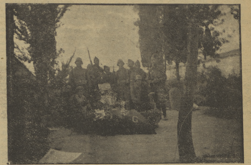
Un grupo de milicianos del P. O. U. M. junto a la tumba del valiente capitán Galán, en el cementerio de Huesca.

Cuando el comandante Reyes, de la aviación roja, se hizo cargo de las dos (Continúa página 6)